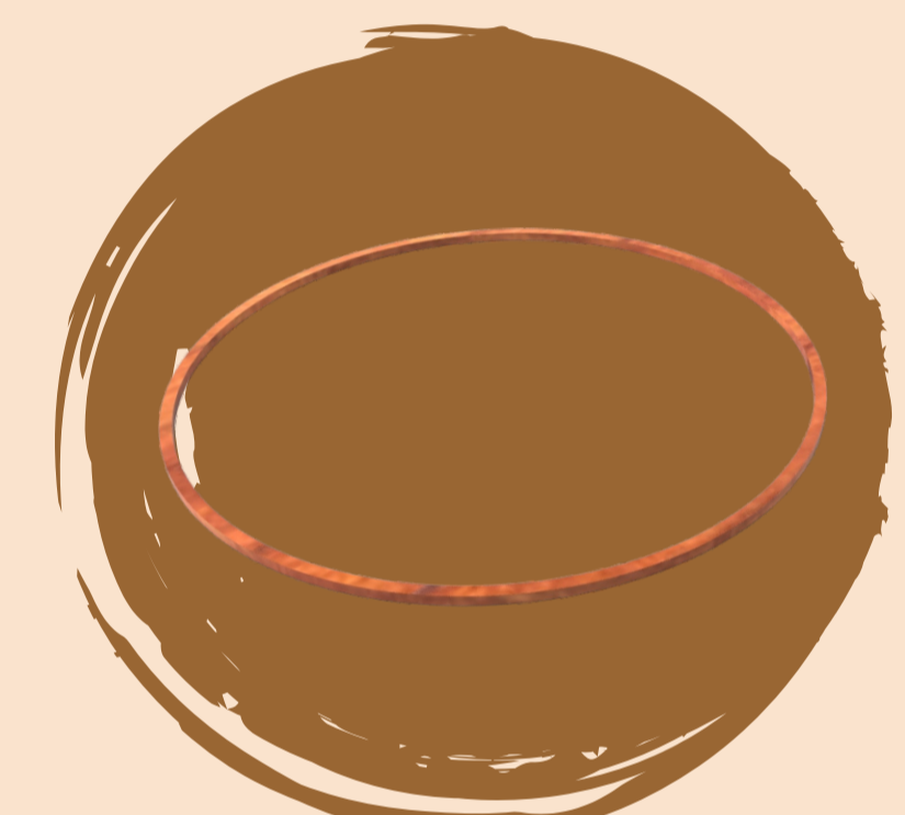
Material: rauli Proceso: CNC