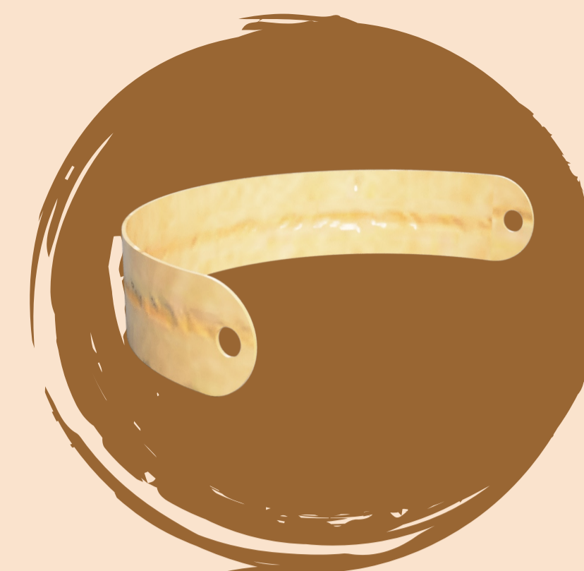
Material: Pino Proceso: laminado y CNC