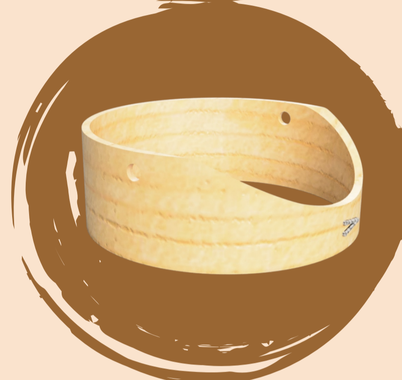
Material: Pino Proceso: laminado y CNC