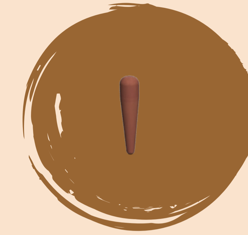
Material: rauli Proceso: torno