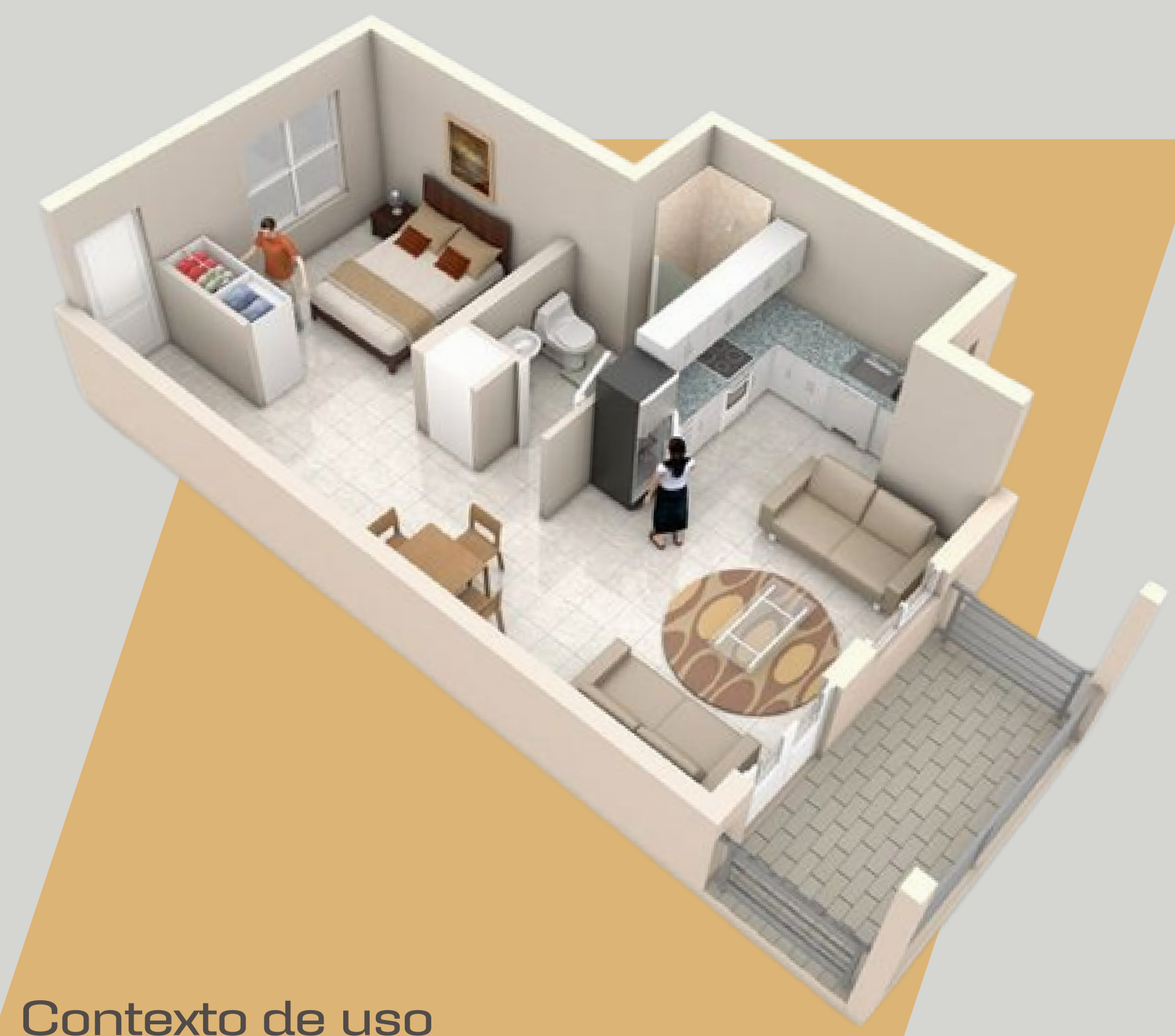
Contexto de uso