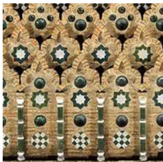
Paño Sebka Iglesia del Salvador (Teruel, España)