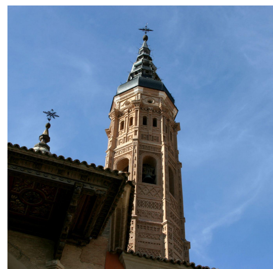
Colegiata Santa María la mayor (Calatayud, España)