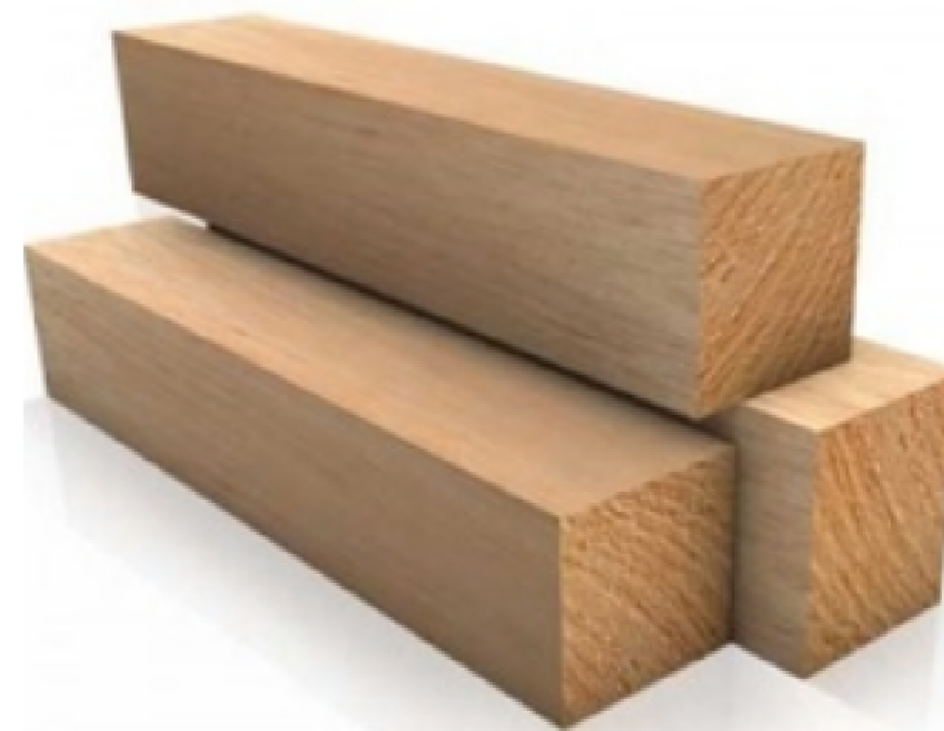
Madera de roble (listones)