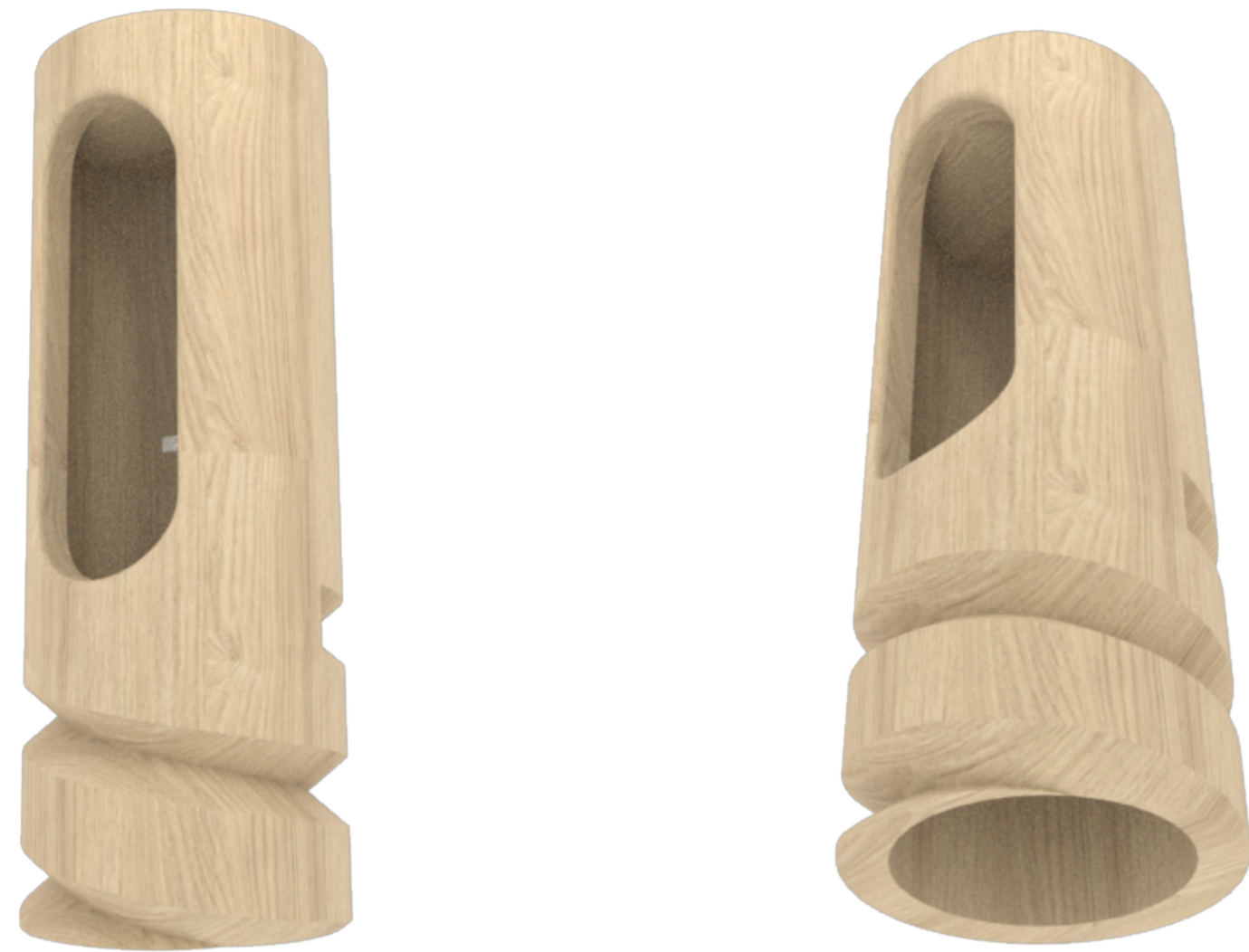
Mecanizado para forma cilíndrica, apertura e hilo a partir de Router CNC