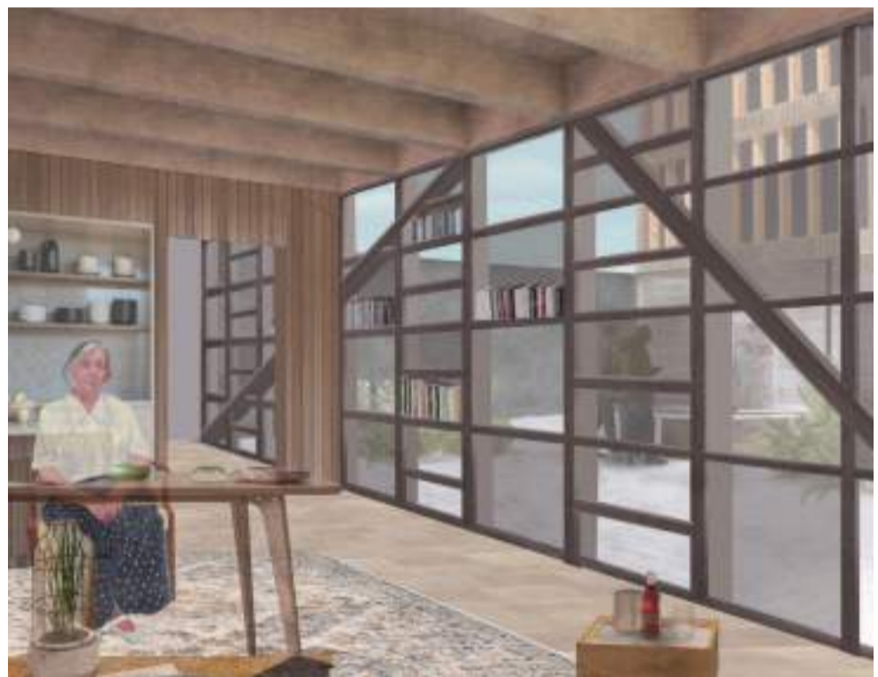
Vista Estructura Interior

Se plantea como un sistema prefabricado, donde se separan los elementos que harán más fácil el montaje de la casa, siendo la estructura principal una trama de madera ingenieril de pilar y viga en MLE, que otorga resistencia, y hace posible grandes luces. Los tabiques interiores, envidados de piso y techo, se presentan en paquetes constructivos tradicionales de madera cepillada, unidas al sistema principal entre la estructura, facilitando la prefabricación de un sistema tradicional.