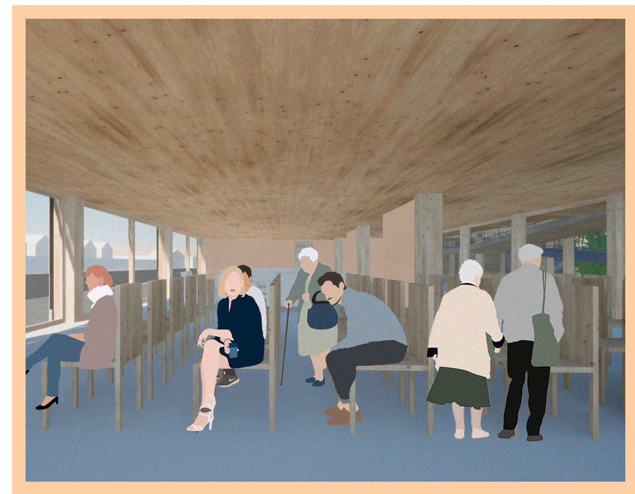
SEDE VECINAL Sede pensada para tener la capacidad de recibir tanto a los vecinos del conjunto como a otros vecinos cercanos. Espacios de reunión que abarcan las actividades y problemáticas referentes a la vida en comunidad organizada.