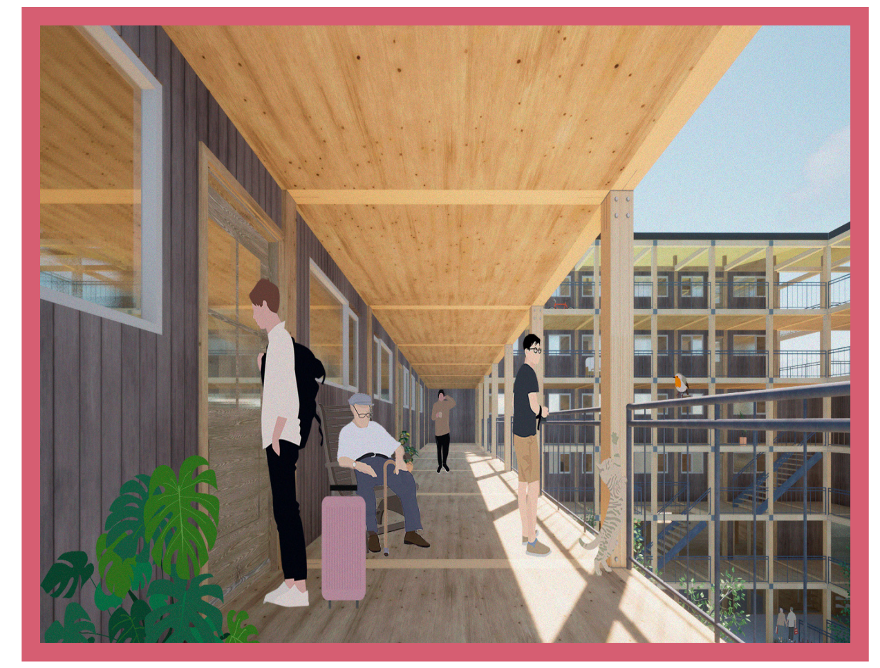
ANILLO El anillo es un espacio articulador que permite el tránsito, encuentro y relación entre vecinos, para incentivar la comunicación vecinal.