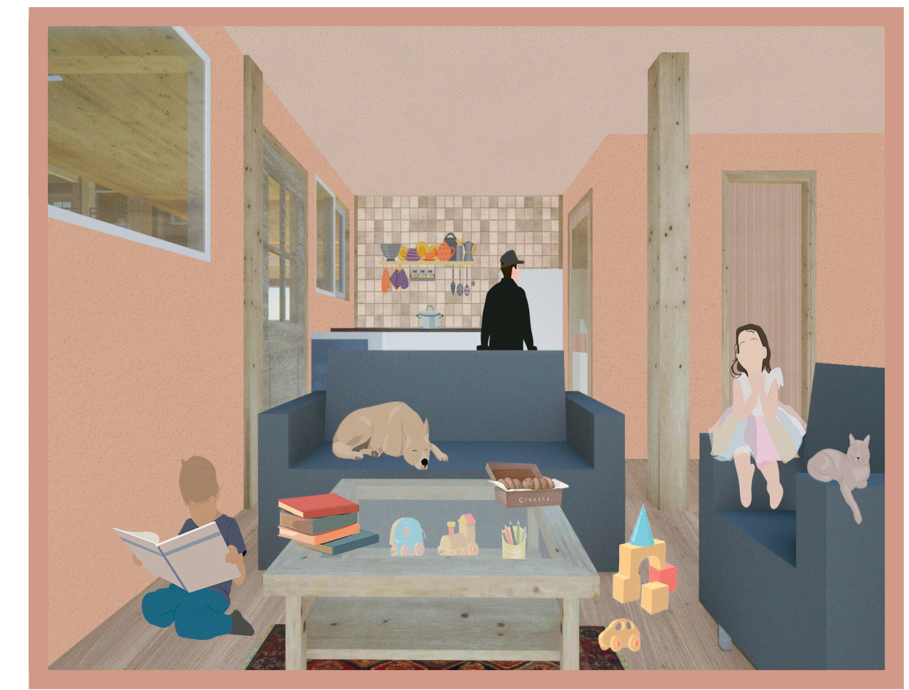
INTERIOR VIVIENDA El estar es el núcleo social de la vivienda, es un espacio de convergencia que permite que las familias compartan, estando tanto en la cocina como en el comedor.