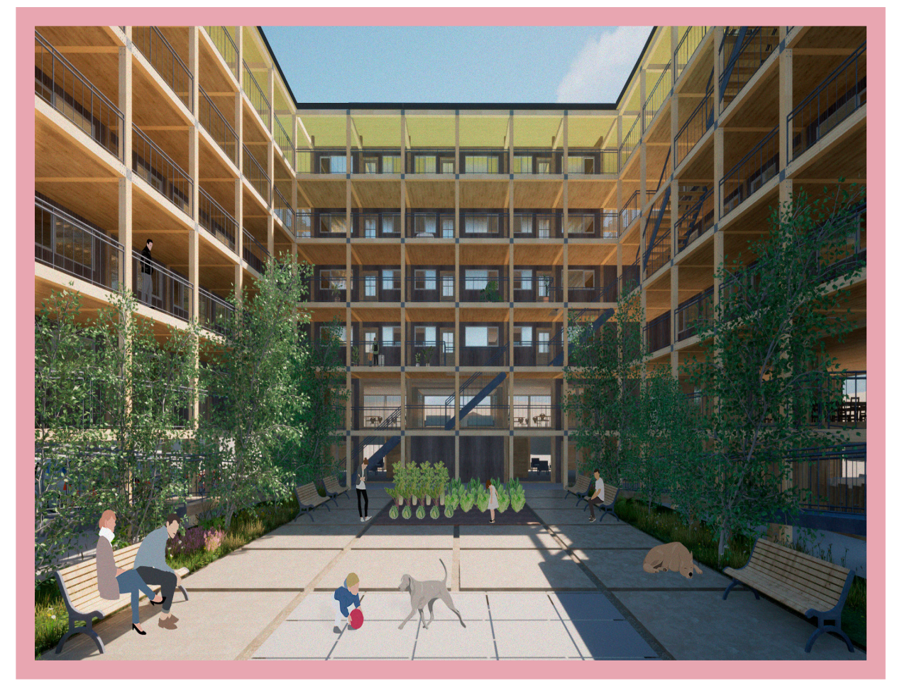
PATIO CENTRAL Espacio intermedio resultante del anillo de circulación. Lugar de estancia y contemplación en los que se reúnen los residentes del conjunto.