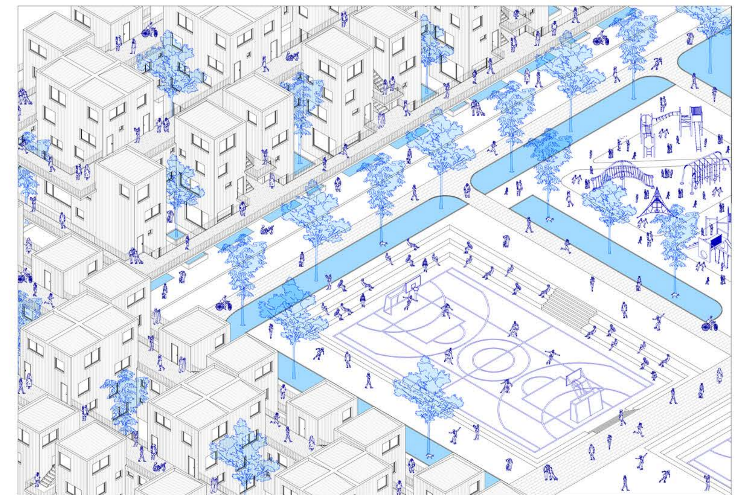
Isometrica de conjunto inmediato ESC. 1:250