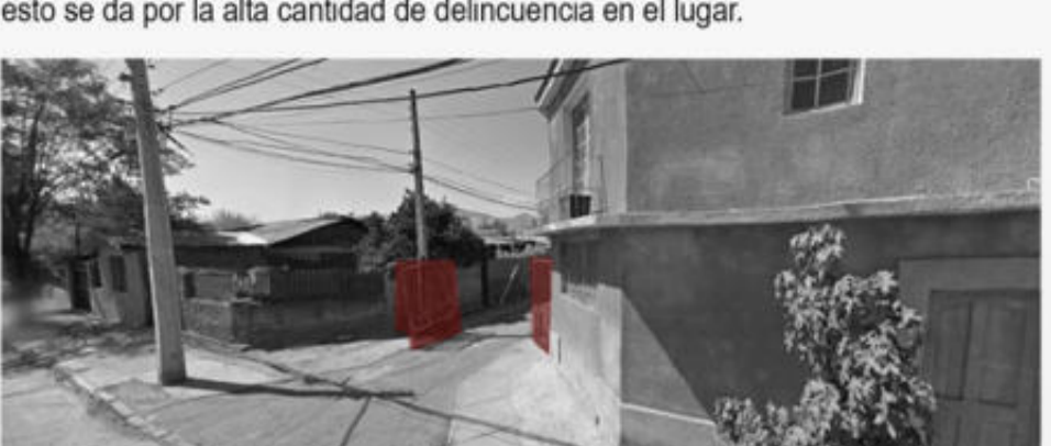
Esto también genera un efecto dominó en su espacio público y su cuidado ya que el desuso trae problemáticas como calles en mal estado.