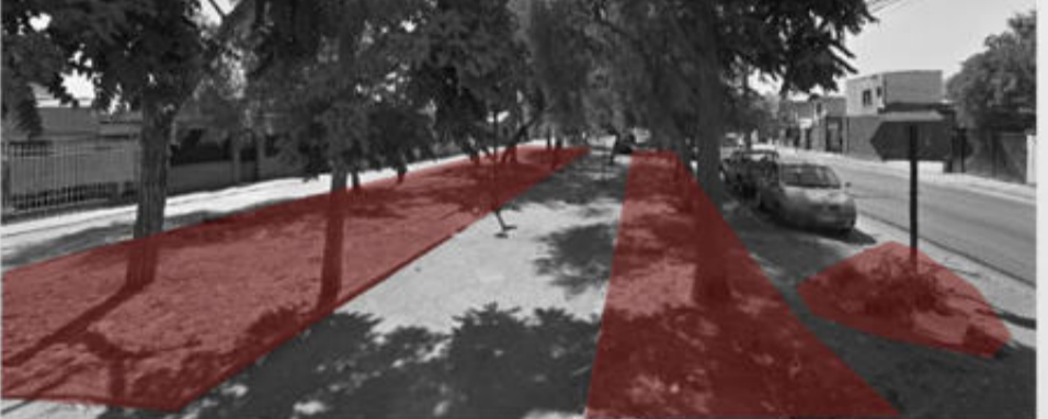
Se hacen presentes micro basurales en varios puntos de la población, los cuales afectan directamente el paso de la gente en las calles.