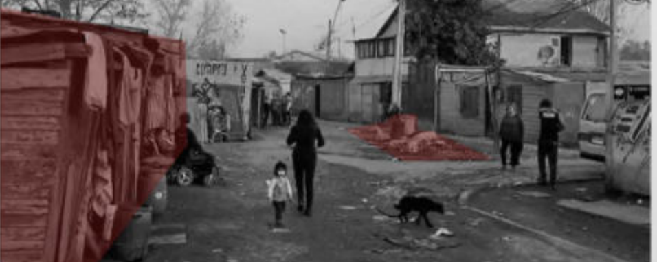
La presencia de viviendas en condiciones deplorables y también asentamientos informales en el sector.