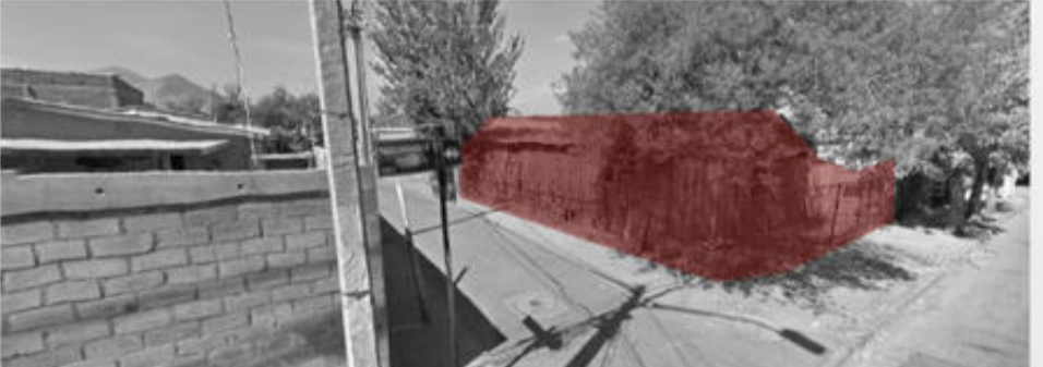
Áreas verdes deficientes y en malas condiciones disminuyen la vida en comunidad de los habitantes.