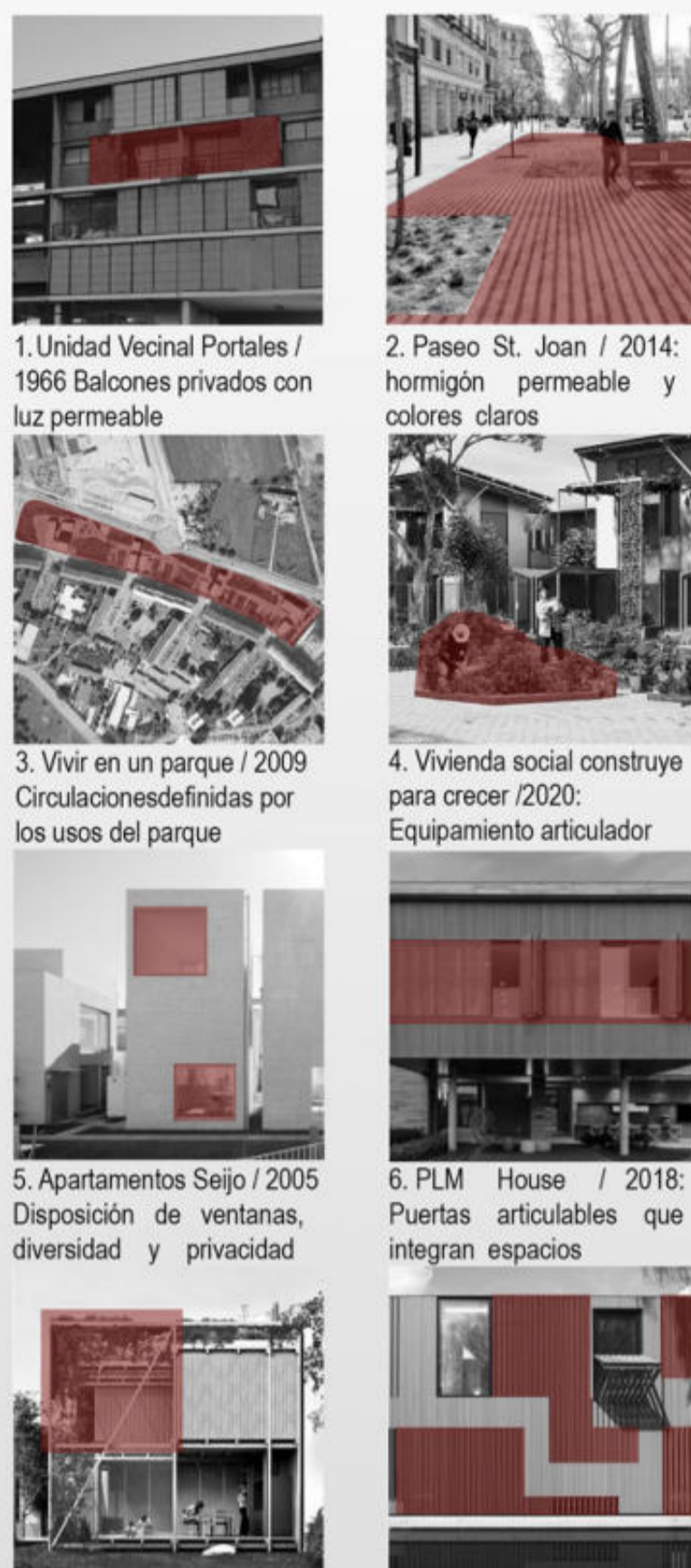
1. Unidad Vecinal Portales / 1966 Balcones Privados con luz permeable 2. Paseo St. Joan / 2014; hormigón permeable y colores claros 3. Vivir en un parque / 2009 Circulaciones definidas por los usos del parque 4. Vivienda social construye para crecer / 2020: Equipamiento articulador 5. Apartamentos Seijo / 2005 Disposición de ventanas, diversidad y privacidad 6. PLM House / 2018: Puertas articulables que integran espacios 7. Proto vivienda sustentable / 2018: Vivienda progresiva con estructura prefabricada 8. Casa sobre el agua / 2011: Privacidad mediante celosías y regulación de la luz