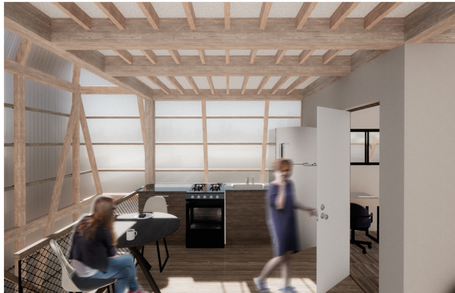
IMAGEN 3: Vista espacio compartido familiar grupo 2.