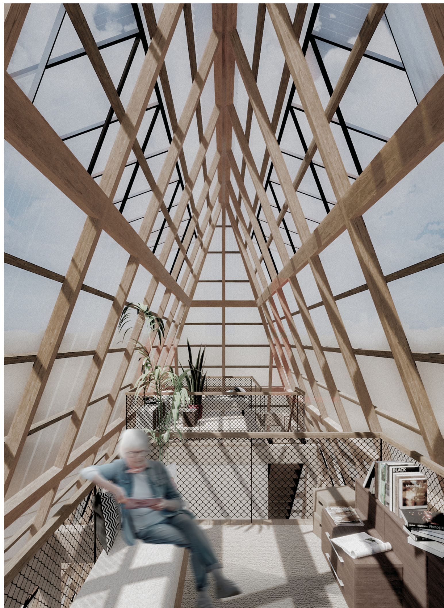
IMAGEN 4: Vista terrazas de uso compartido grupos familiares.