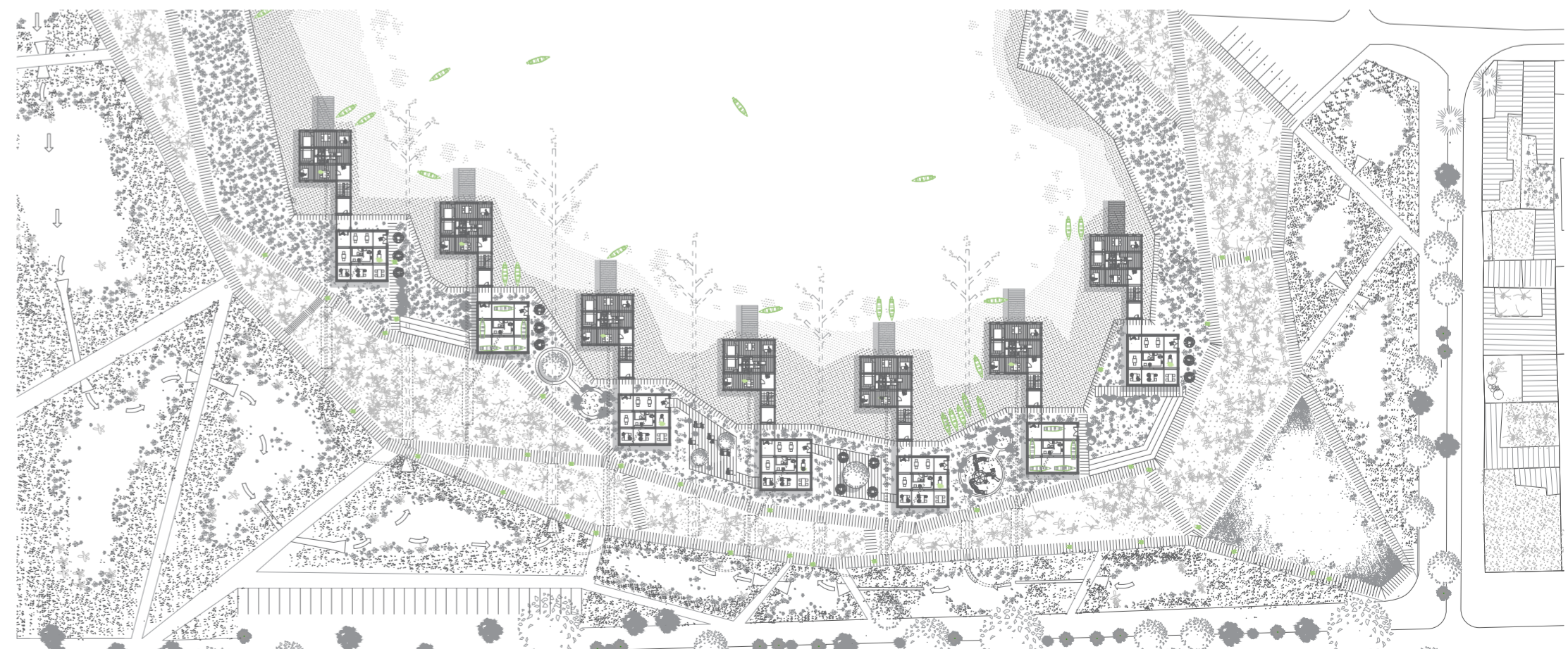
MASTERPLAN ESC 1:1000