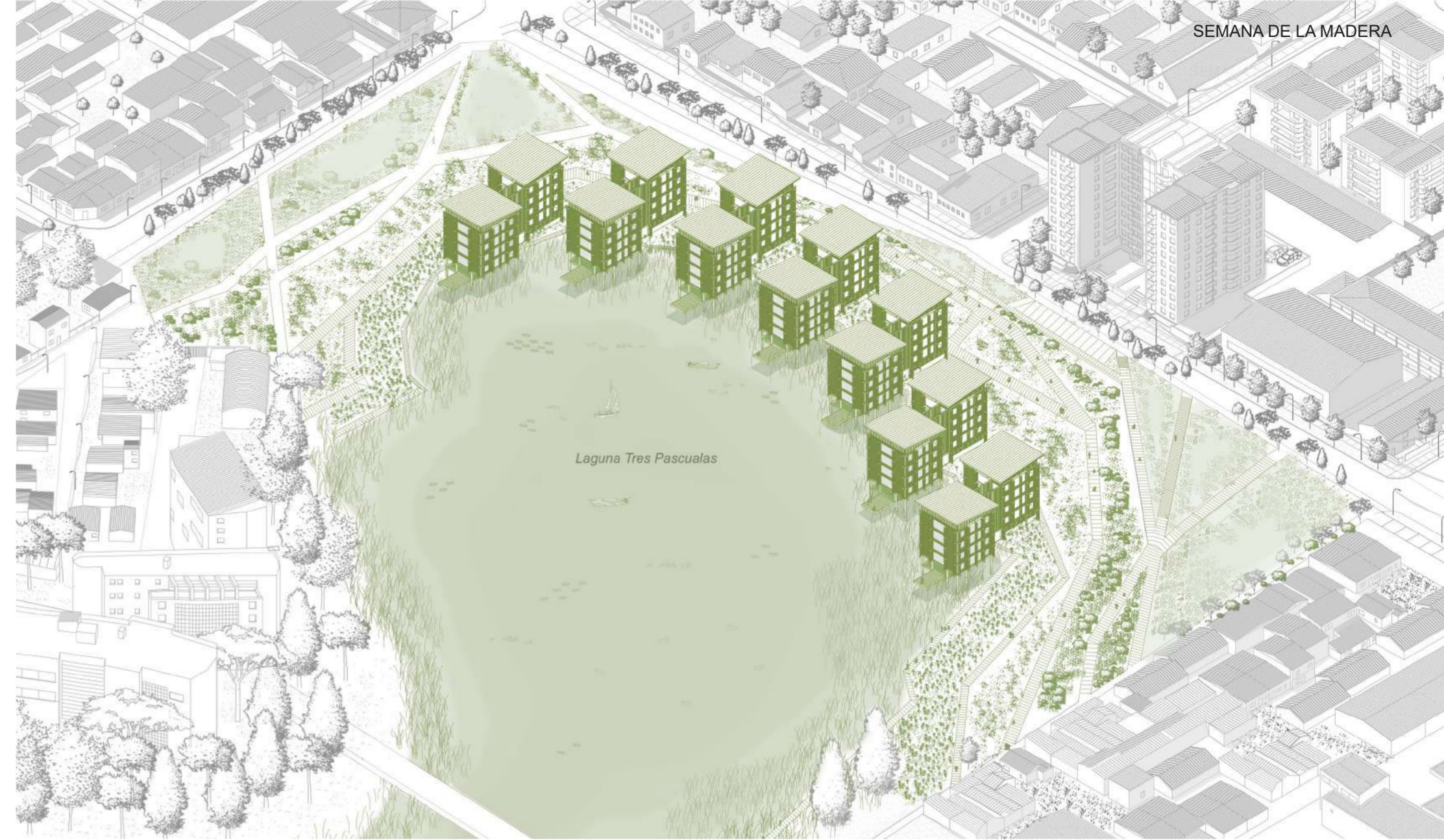
AXONOMETRICA ESC 1:1000

El proyecto se encuentra emplazado en la octava región, una zona caracterizada por la presencia de cuerpos de agua cercanos a la ciudad. La ciudad de Concepción cuenta con cinco lagunas vigentes, además de dos que desaparecieron por la intervención humana, el proyecto se ubica en el centro de la ciudad, específicamente en la laguna tres pascualas.