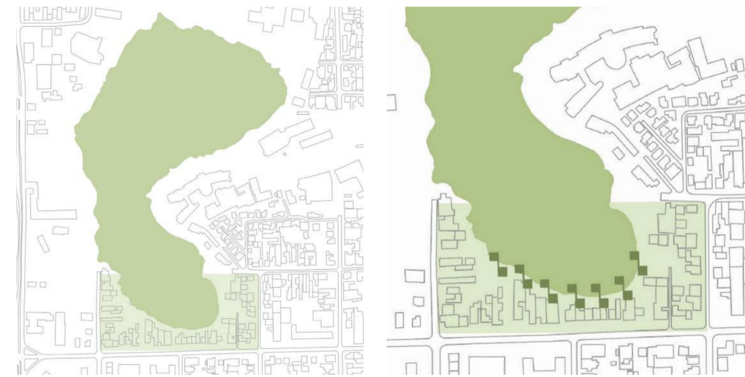
LAGUNA TRES PASCUALAS

Además, el proyecto contempla la creación de humedales que cumplen la función de recolección y purificación de aguas grises el cual conecta las viviendas con los humedales de la propuesta, ya que la vegetación presente en estas zonas es la que se encarga de limpiar el agua que es finalmente devuelta a la laguna mediante cañerías ubicadas bajo el proyecto. Igualmente posee un sistema de recolección de agua de lluvia, las cuales también se almacenan en los humedales con la finalidad de evitar inundaciones en el sector durante las temporadas de lluvia.