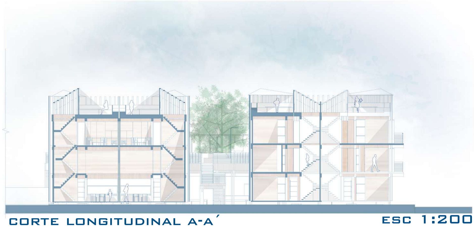
CORTE LONGITUDINAL A-A' ESC 1:200