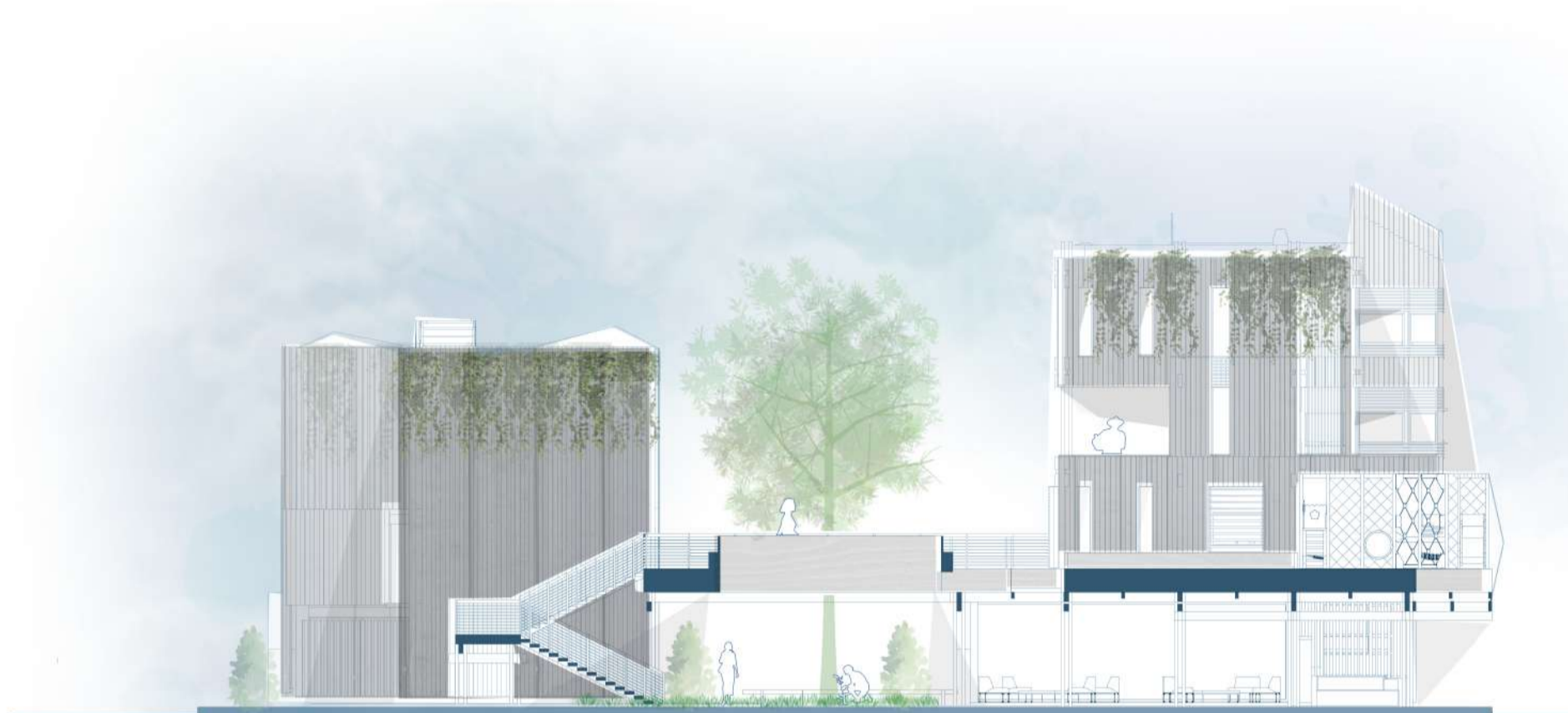
CORTE TRANSVERSAL B-B' ESC 1:200