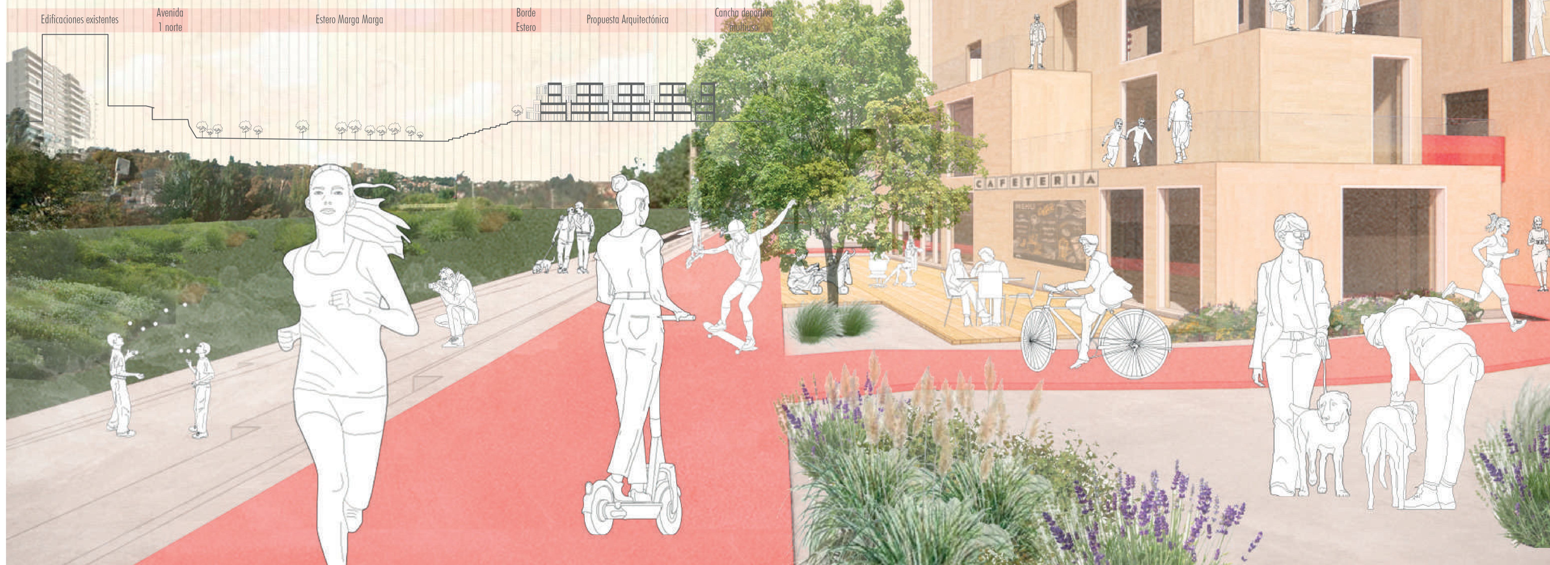
Corte longitudinal escala 1:600

El proyecto toma a la Población Riesco, ubicada a un costado del estero Marga-Marga, Viña del Mar, esta cuenta con una excelente conectividad al centro comercial de la ciudad, teniendo a pocos pasos la feria y mercado. La propuesta busca crear un conjunto habitacional de uso mixto, que permita que las pymes existentes en la población puedan unirse a esta red comercial a través de un local en la vivienda, con el fin de que generen sus ingresos sin la necesidad de dejar el hogar. Para potenciar esto se crea un eje deportivo que se entrelaza con la vegetación del estero que va metiéndose por los pasajes, generando paseos peatonales verdes.