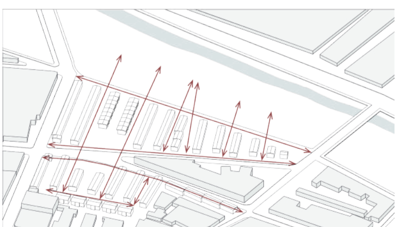
Todos los pasajes se convierten en paseos peatonales que conectan el estero con las viviendas.