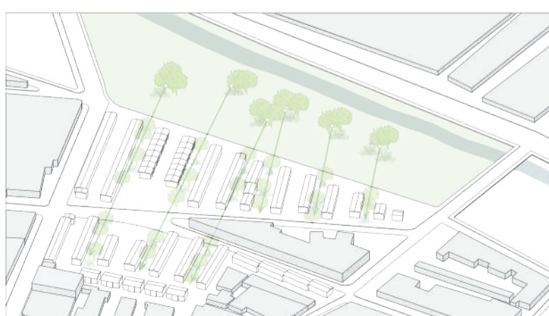
La vegetación del estero entra por los paseos peatonales, generando áreas verdes.