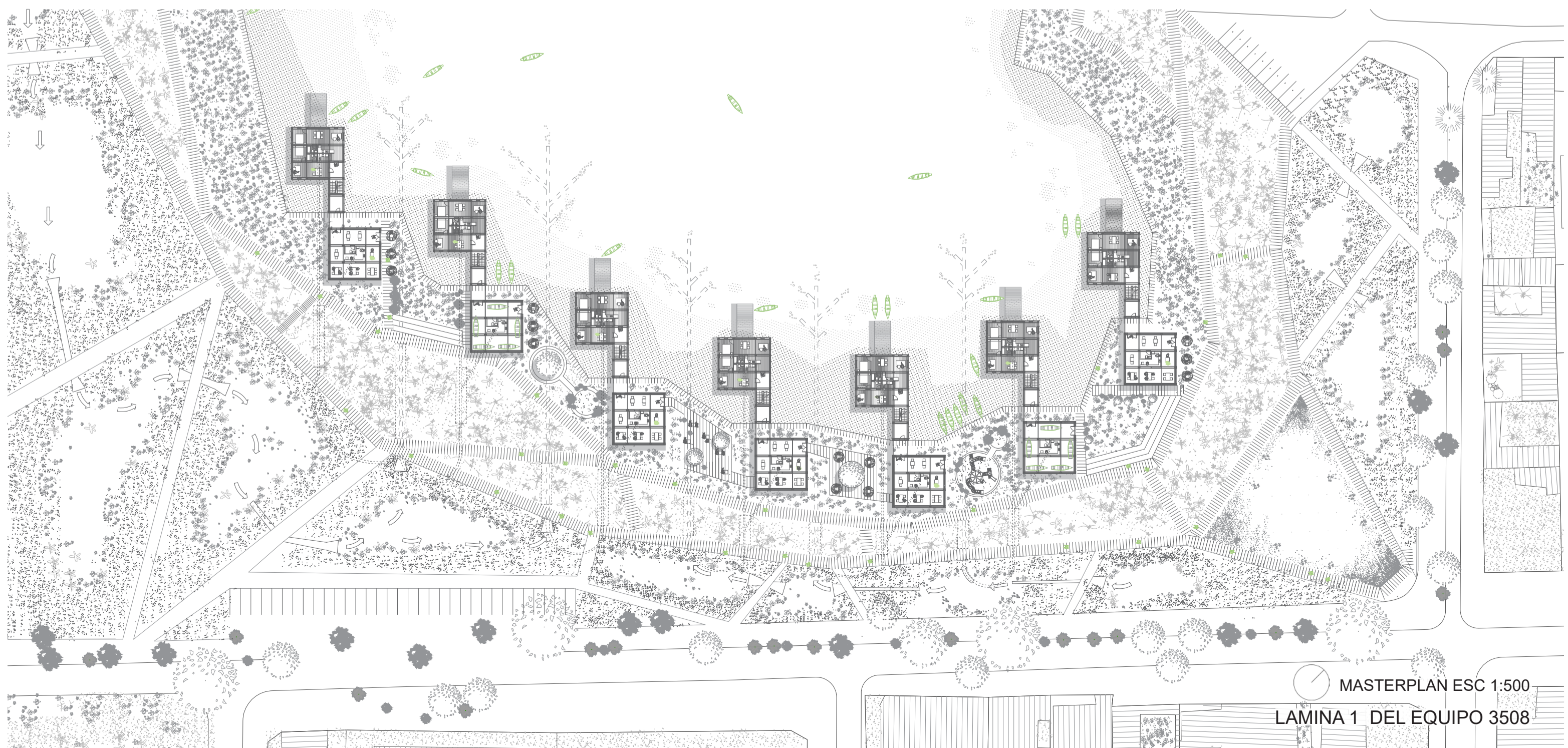
MASTERPLAN ESC 1:500