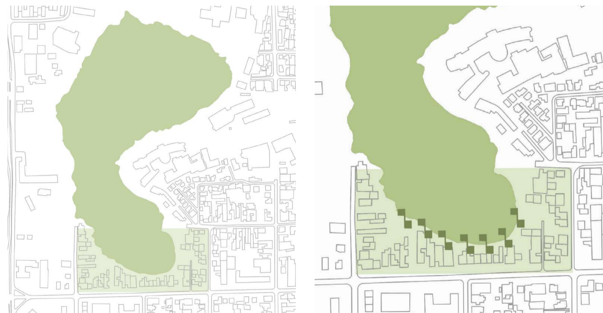
LAGUNA TRES PASCUALAS

Además, el proyecto contempla la creación de humedales que cumplen la función de recolección y purificación de aguas grises el cual conecta las viviendas con los humedales de la propuesta, ya que la vegetación presente en estas zonas es la que se encarga de limpiar el agua que es finalmente devuelta a la laguna mediante cañerías ubicadas bajo el proyecto. Igualmente posee un sistema de recolección de agua de lluvia, las cuales también se almacenan en los humedales con la finalidad de evitar inundaciones en el sector durante las temporadas de lluvia.