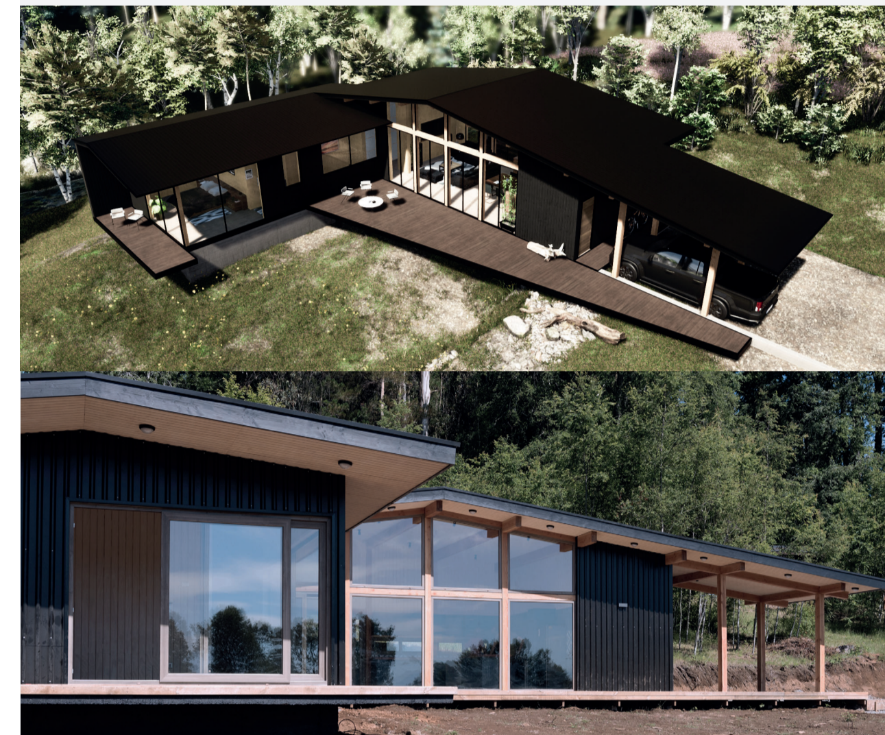
1. Render, vista área - 2. Fotografía, Vista exterior costado sur.

El encargo consistió en el diseño de una casa con la posibilidad de ampliación futura, ubicada en el sur de Chile, comuna de Villarrica, en un terreno con pendiente y bosque. Se tomó la decisión de emplazarla en la parte alta del sitio y en el límite bajo de la vegetación, respetando los árboles existentes y buscando con la altura una mejor vista del Volcán Villarrica.