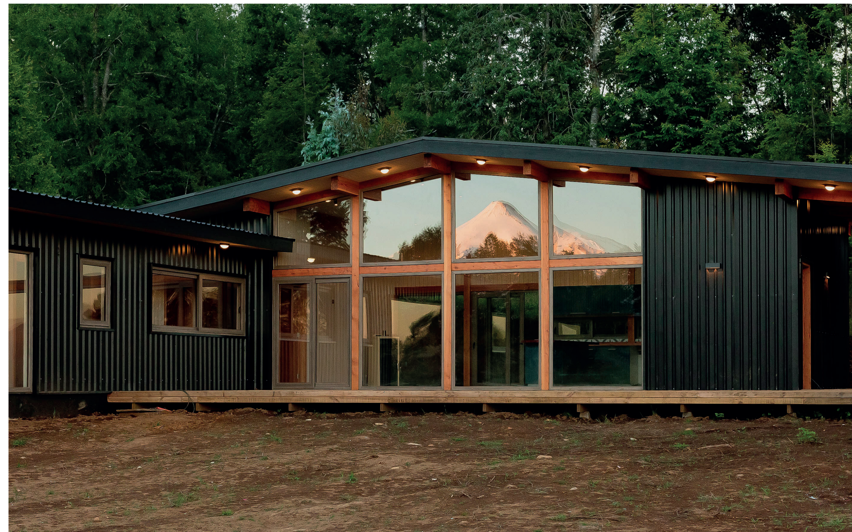
Fotografía exterior, vista frontal.

Para los revestimientos exteriores, se usaron planchas metálicas en muros y techumbres, generando una envolvente continua. Interiormente los paneles fueron revestidos con tablero de madera ranurada tipo MDF enchapado en pino. Igualmente, se utiliza la madera como elemento constructivo para las diferentes terminaciones de la casa.