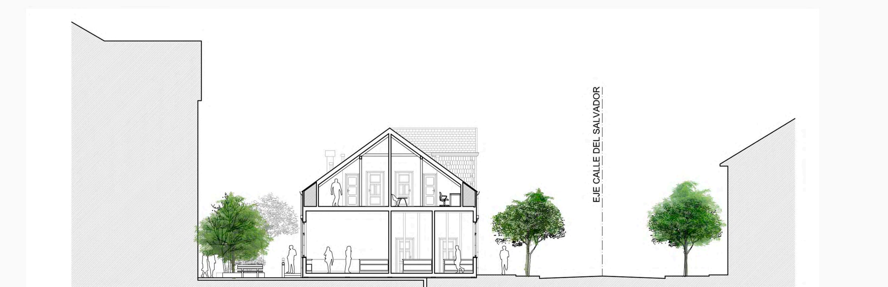
corte transversal casa Wiehoff