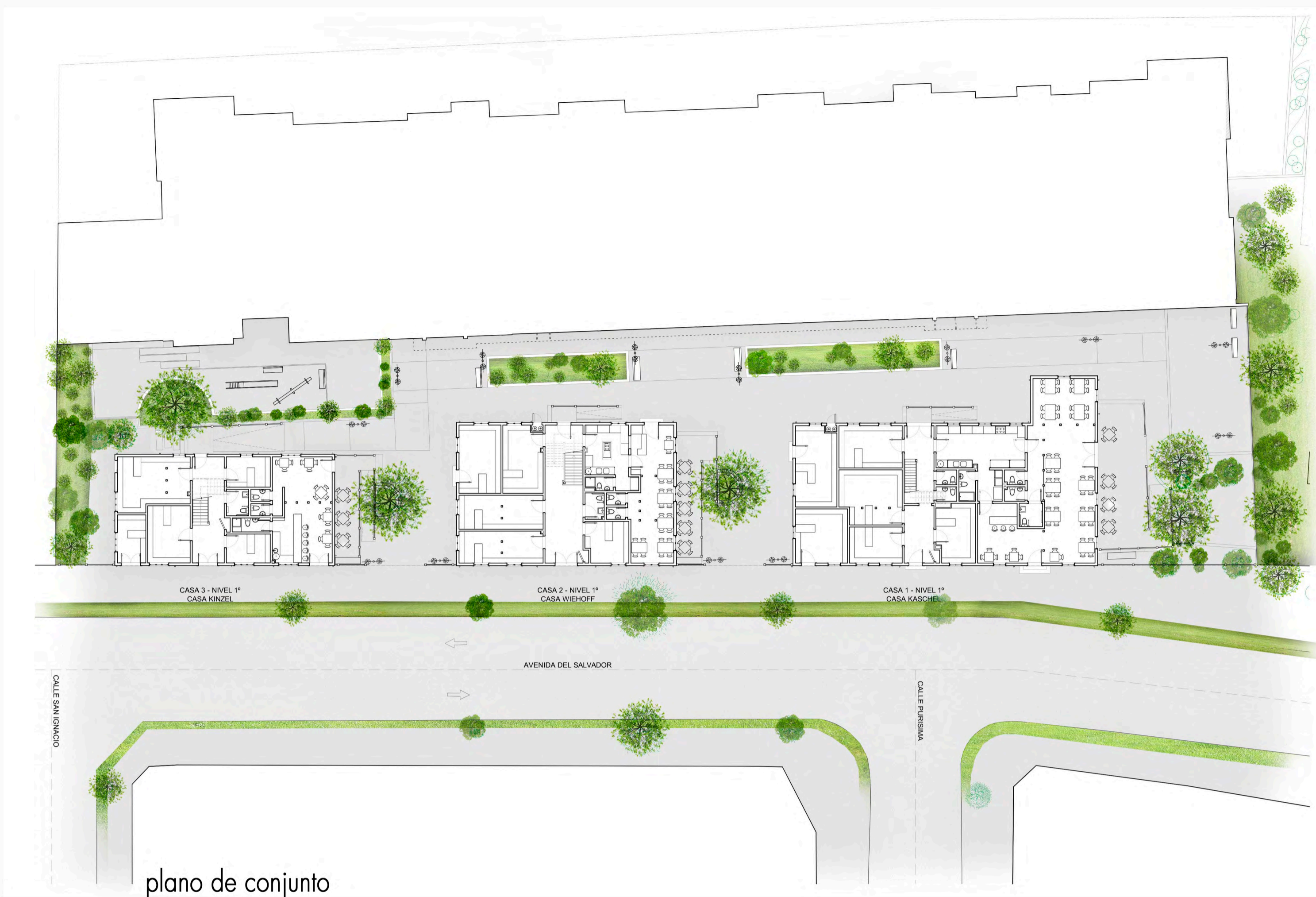
plano de conjunto