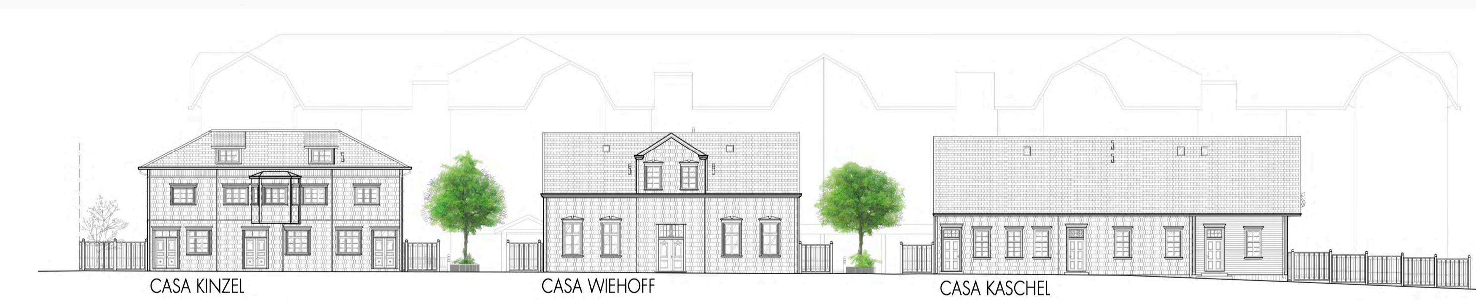
elevación de conjunto