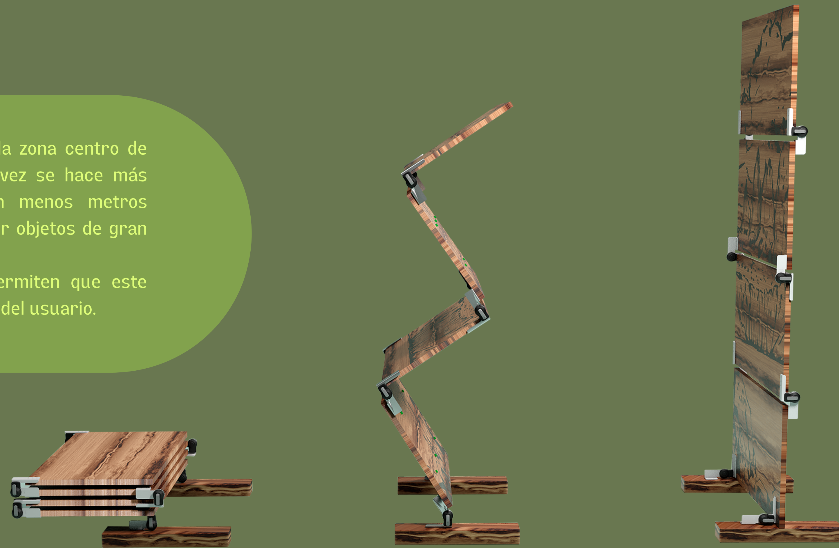
Paso 1: Sacar Divide-place del lugar en el que fue guardado

Debido a la sobrepoblación que existe en la zona centro de nuestro país especialmente es que cada vez se hace más común ver casas o departamentos con menos metros cuadrados y sin tanto espacio para guardar objetos de gran tamaño. Las bisagras utilizadas en Divide-place permiten que este pueda plegarse y adaptarse a los espacios del usuario.