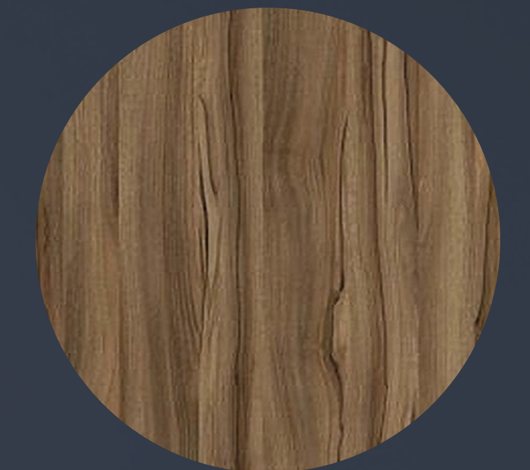
madera de nogal