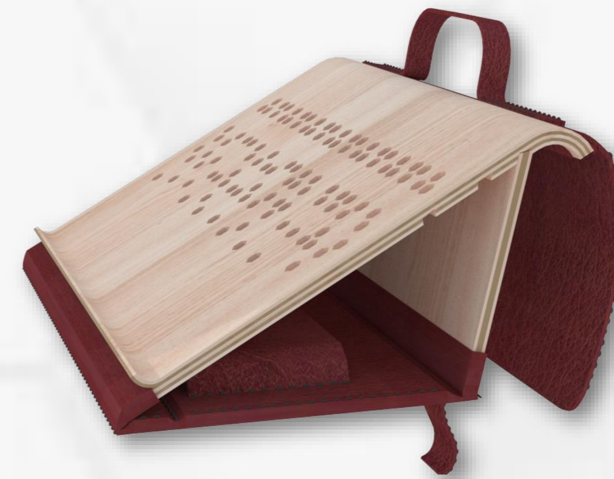
NIVEL 1 30°