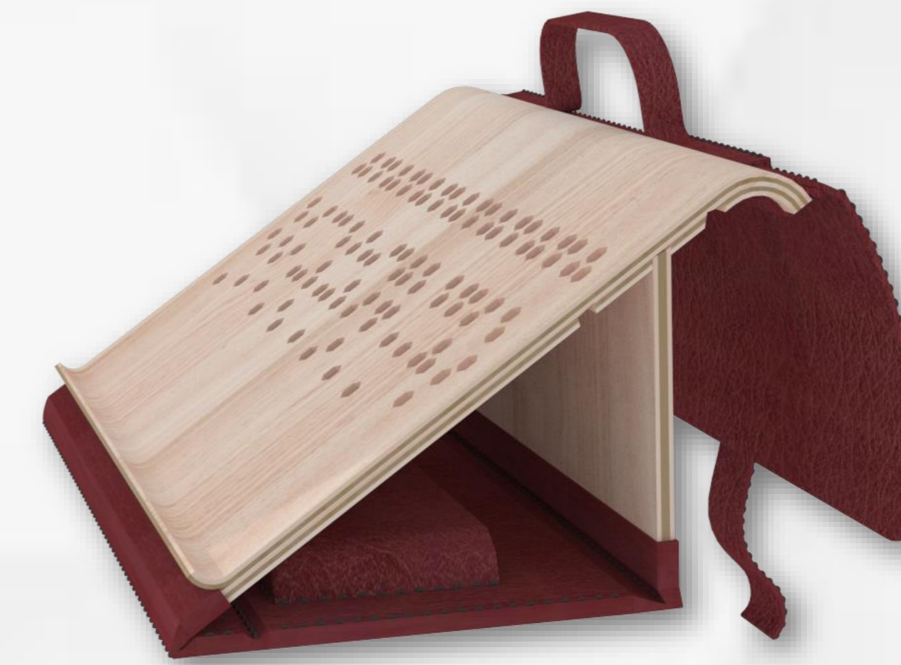
NIVEL 2 35°