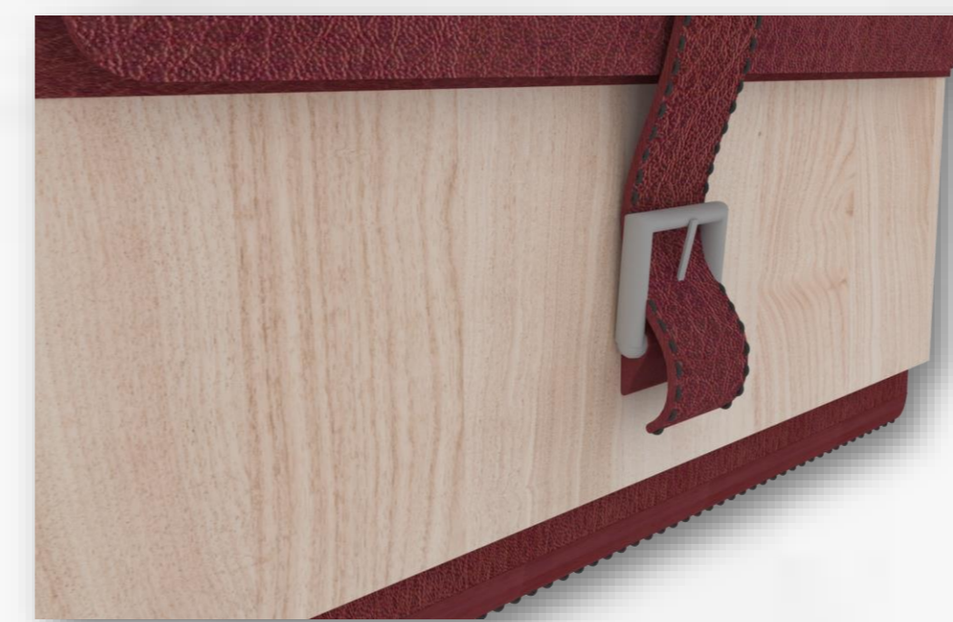
Hebilla y broches de presión encargados de mantener cerrado el producto.