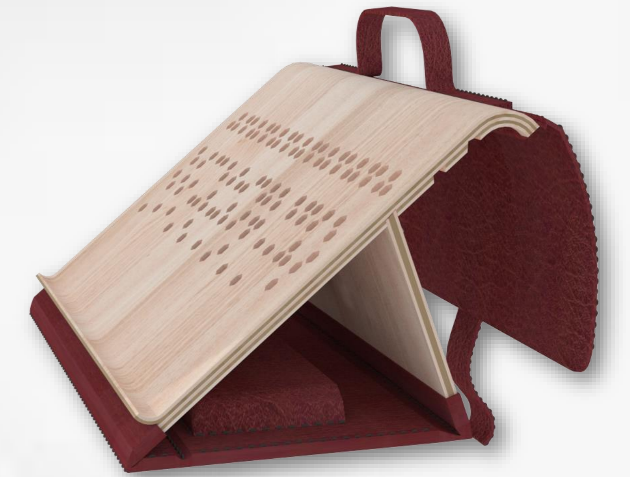
NIVEL 3 40°