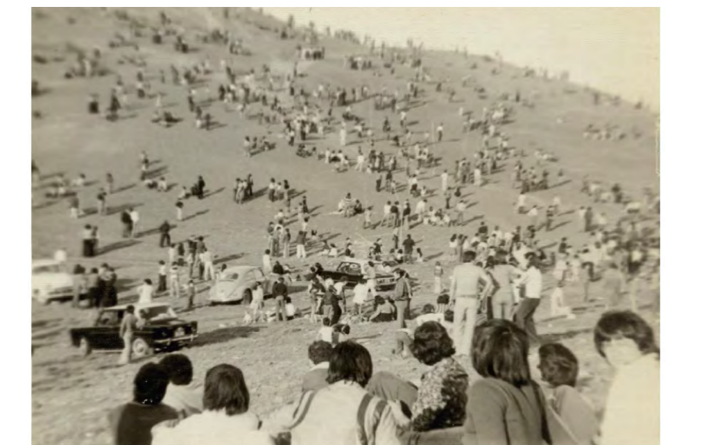
Paseo al cerro en fiestas patrias