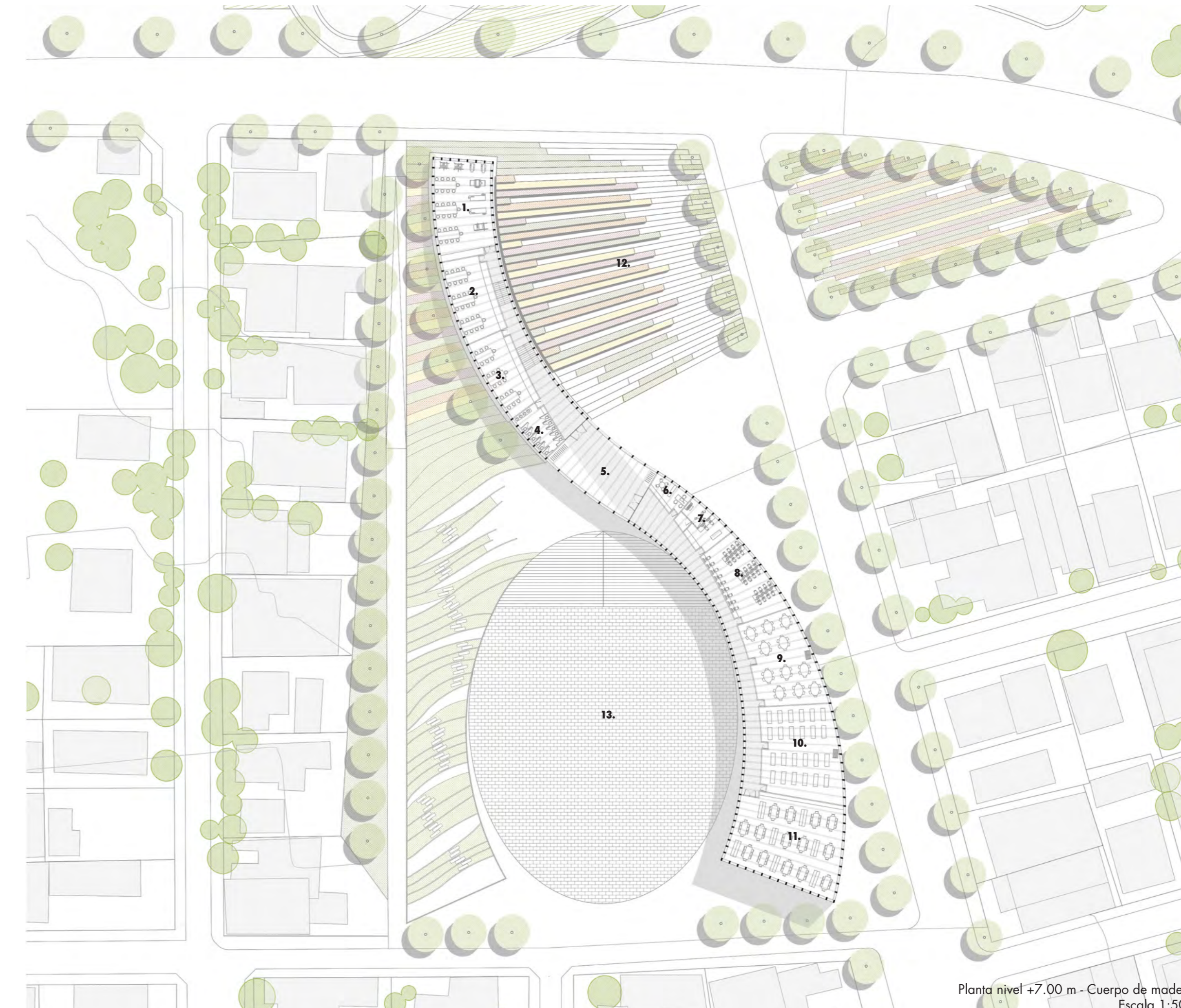
Planta nivel +7.00 m - Cuerpo de madera Escala 1:500