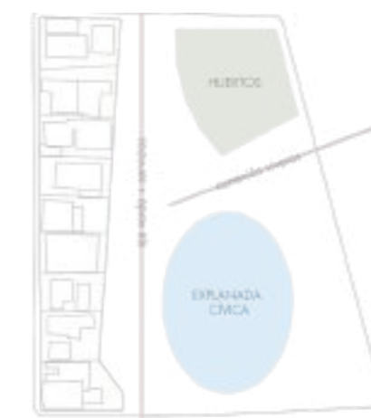
1. Definir el espacio público