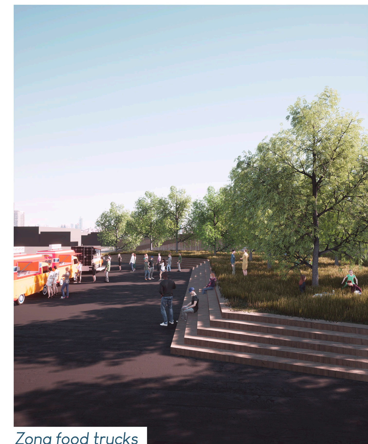
Zona food trucks