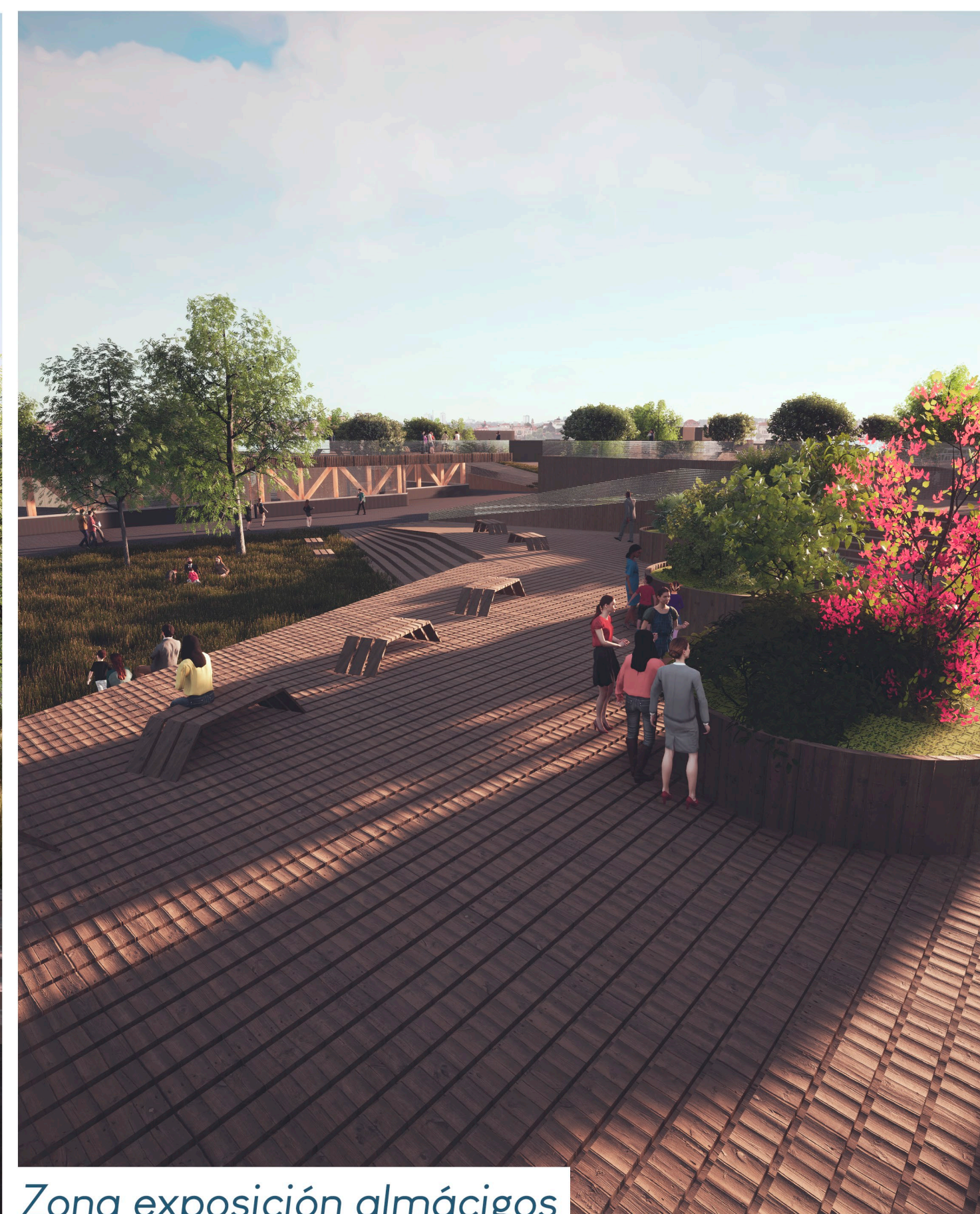
Zona exposición almácigos

Se ubica en la ciudad de Los Ángeles , reconocida como la capital maderera del país producto de su alto impacto en la producción de esta. Ciudad que sin embargo no tiene relación con el material más allá de la actividad industrial, sin grandes vínculos con la comunidad.