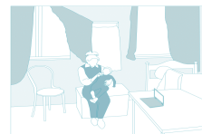
Falta de espacio