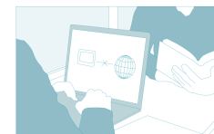
Conexión a internet