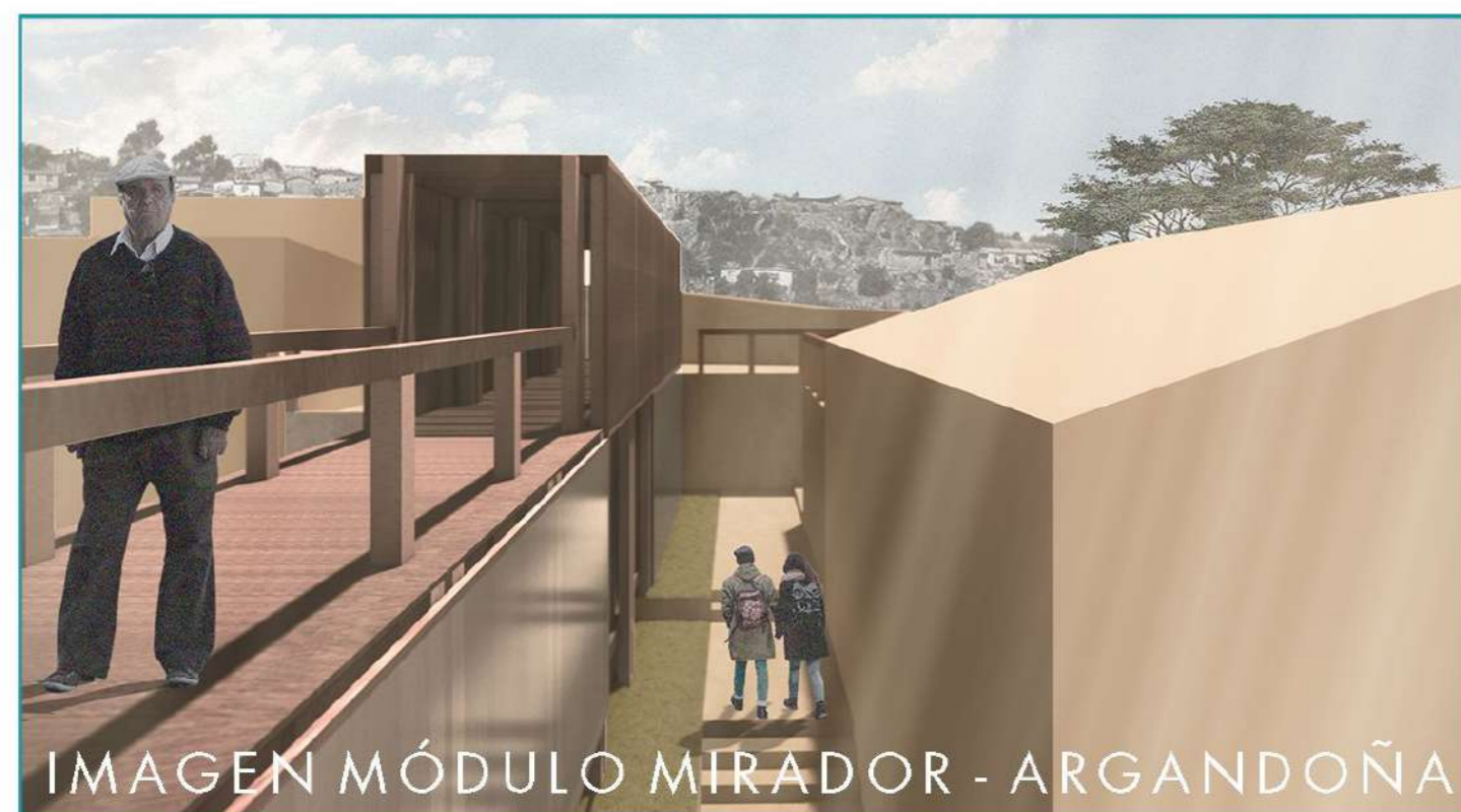
IMAGEN MÓDULO MIRADOR - ARGANDOÑA