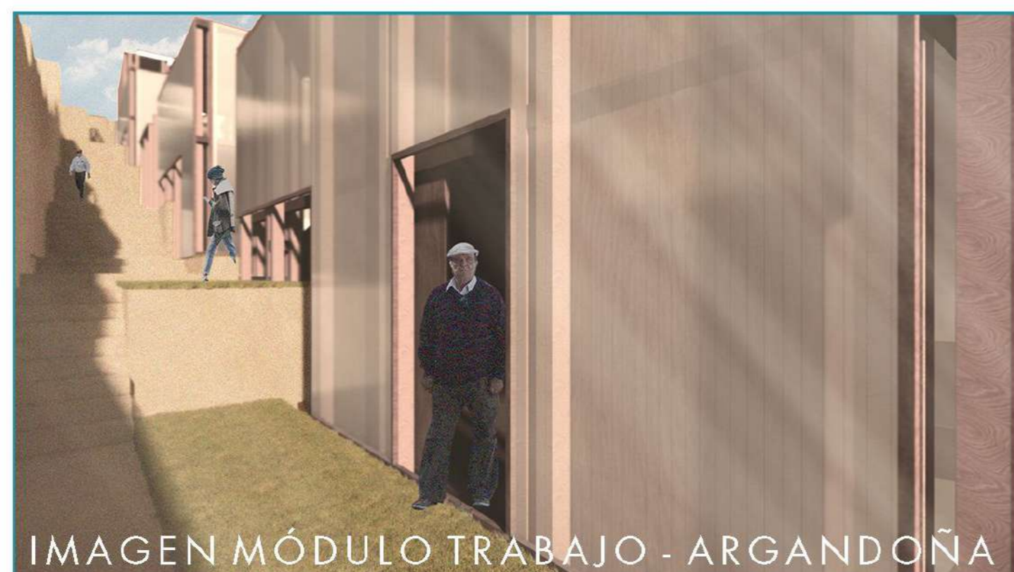
IMAGEN MÓDULO TRABAJO - ARGANDOÑA