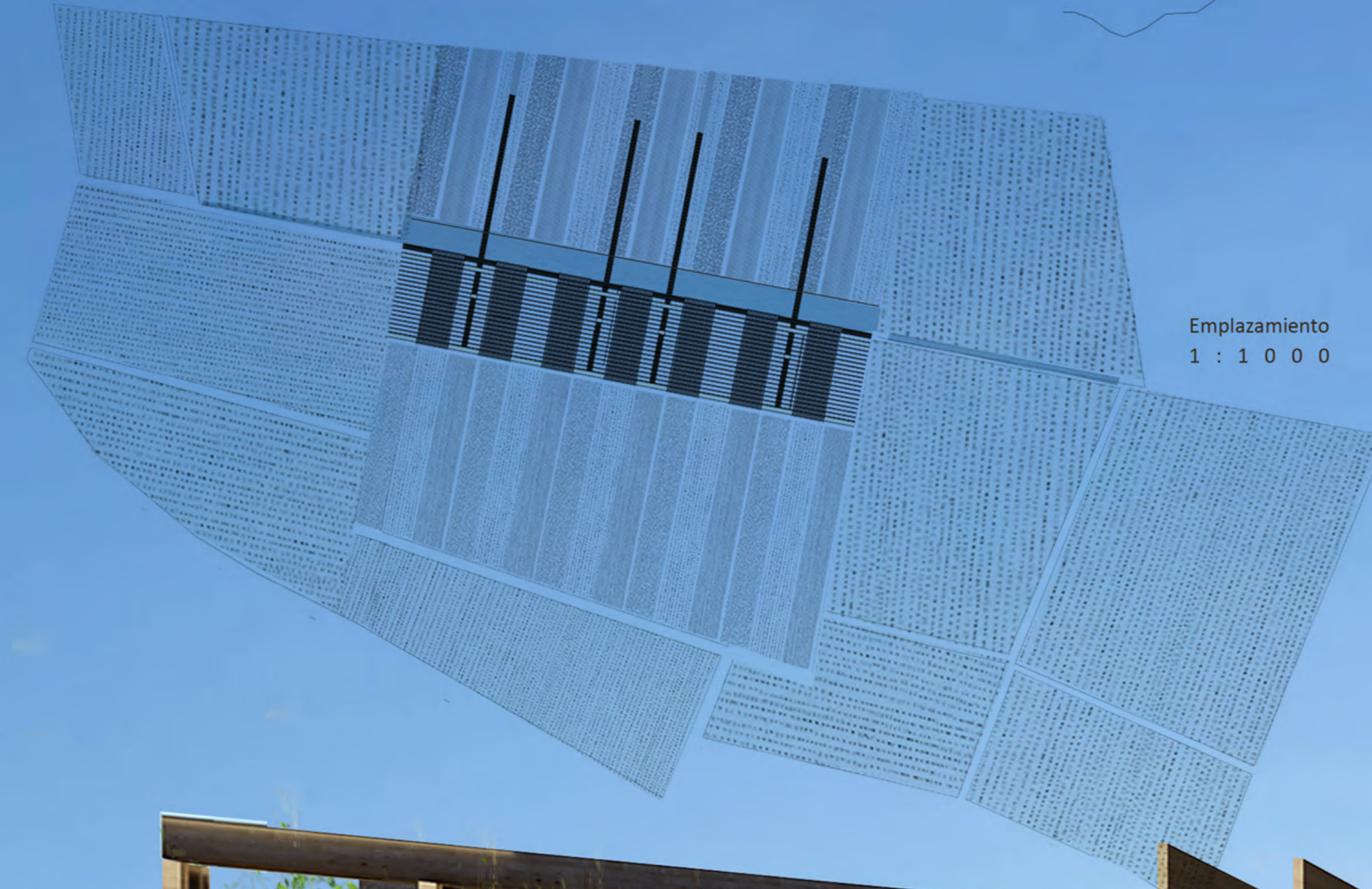
Emplazamiento 1 : 1 0 0 0