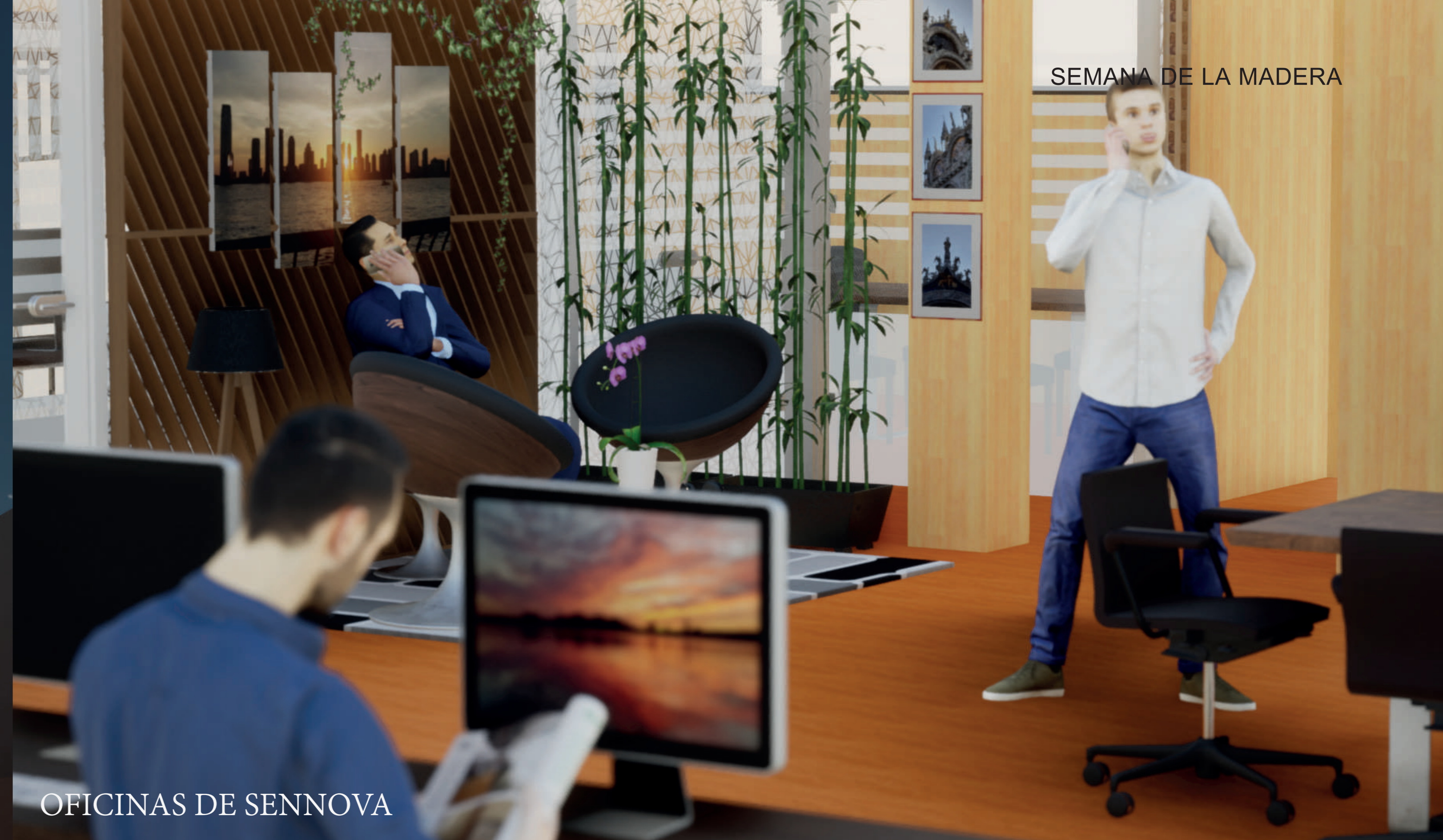
SEMANA DE LA MADERA