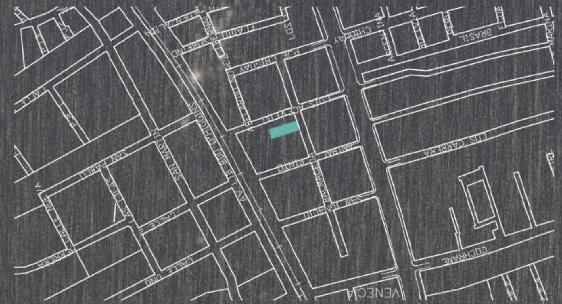
EMPLAZAMIENTO ESCALA 1:500