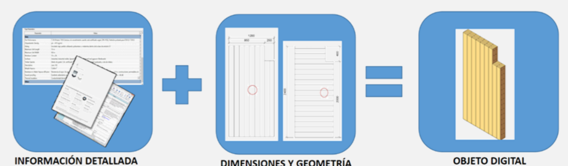
Figura 5: Estructura de un objeto BM