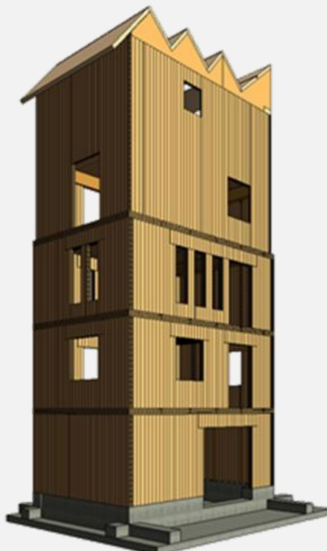
Figura 6: Edificio Pyme Lab Madera modelado con objetos BM