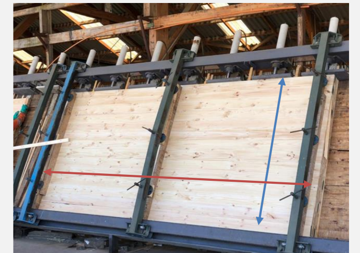
Figura 4: Panel CLT máximo de ancho y largo

Fue necesario realizar una visita en terreno a una planta que fabrica CLT.