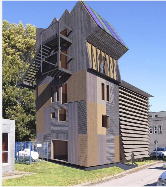
Figura 1: Render Edificio Pyme Lab Madera

Para este trabajo con el fin de crear el proyecto en base a un modelo virtual realizado con objetos digitales que lo representen y así poder lograr una mejora en la coordinación y comunicación de las distintas especialidades que participan, generando de esta manera un flujo de trabajo colaborativo del diseño del proyecto, específicamente la comunicación entre diseñador y fabricante se realizó una librería de digital compuestas por objetos BIM en madera contralaminada (Figura 2).