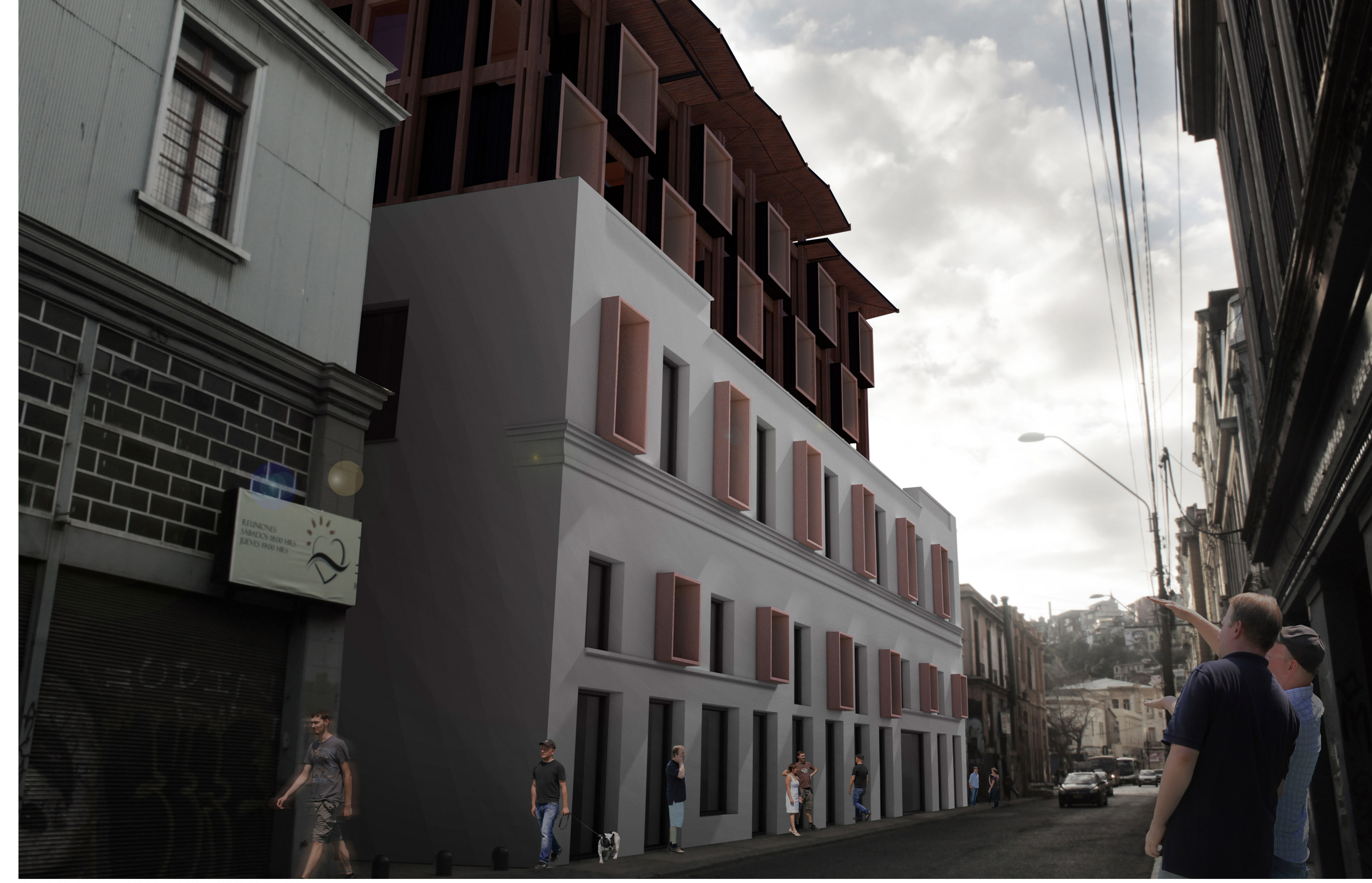
MODULOS RESIDENCIALES, HACIA CALLE COCHRANE

PRINCIPIO ESTRUCTURAL Estructura estereotómica: Muros masisos de ladrillo. Estructura tectónica: esqueleto ligero. Consiste en una estructura compuesta por un entramado de vigas y pilares de madera laminada. Este esqueleto, aloja en su interior los módulos prefabricados de CLT funcionando como arriostre del esqueleto. Parte de los módulos se anclan o modo de arbotantes al muro de ladrillo.