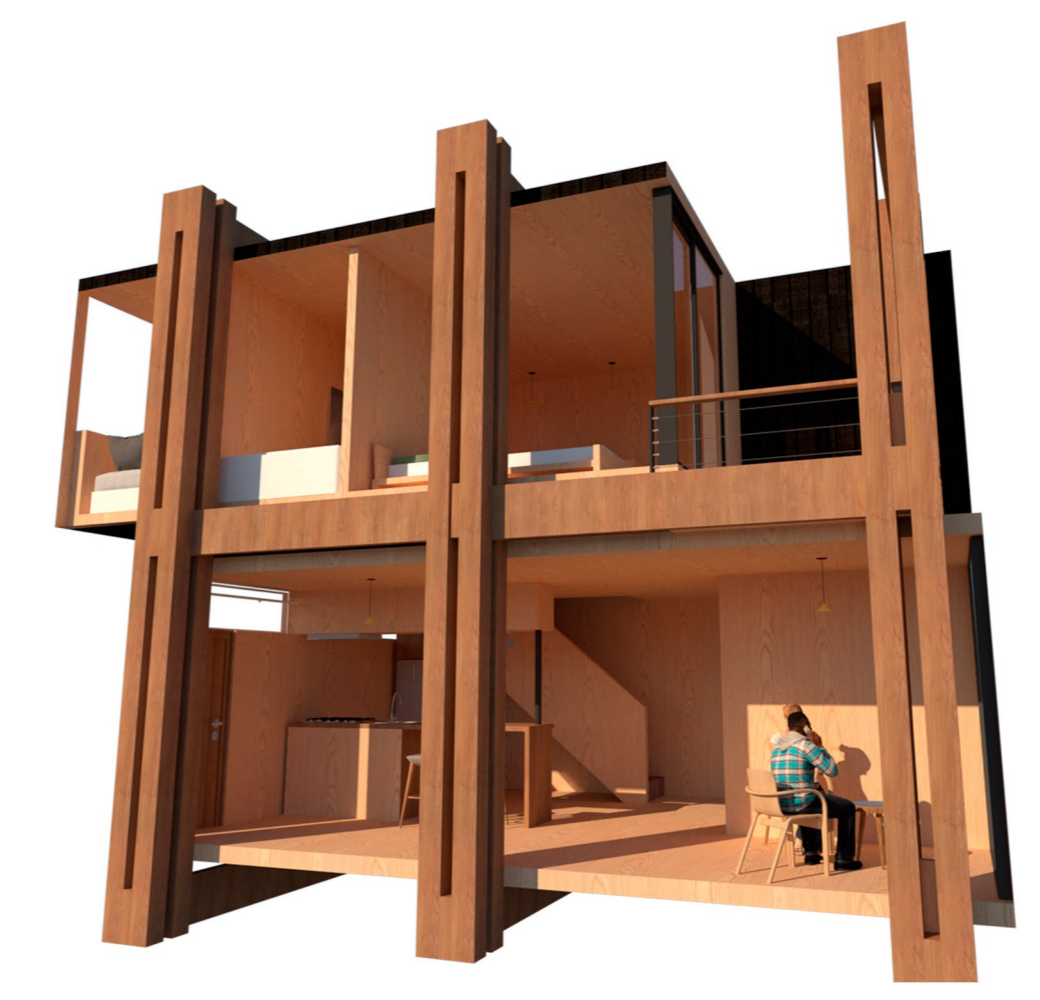
Modulo anclado al esqueleto tectonico