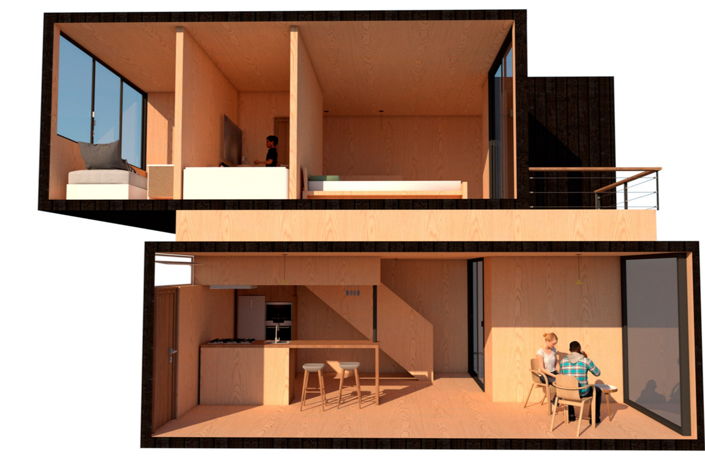
Desarrollo interior Duplex