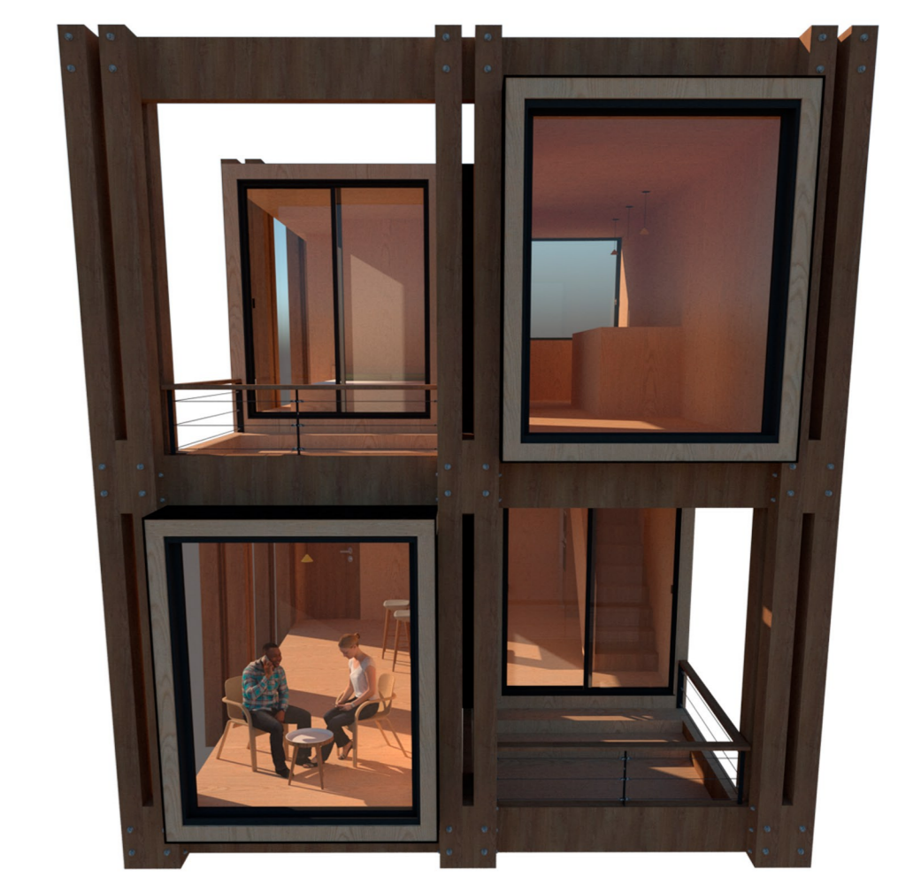
Balcones interiores y terrazas cubierta