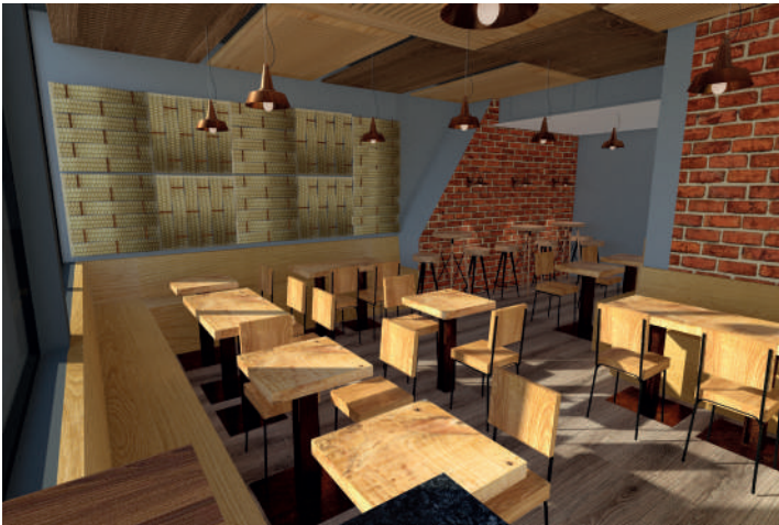
Visualización 3d en contexto

En cuanto a la terminación de la madera, está a disposición de la elección usuario y éste también puede elegir la orientación de los módulos formando así un conjunto a su gusto.