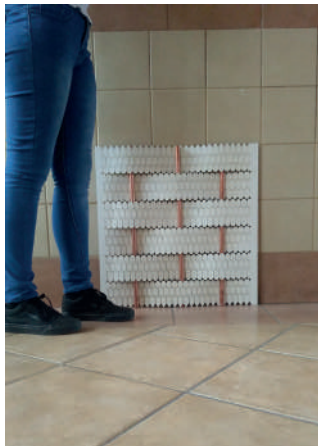
Prototipo cortado en láser