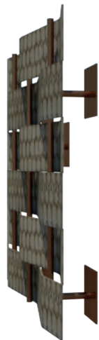
Fijación a la pared