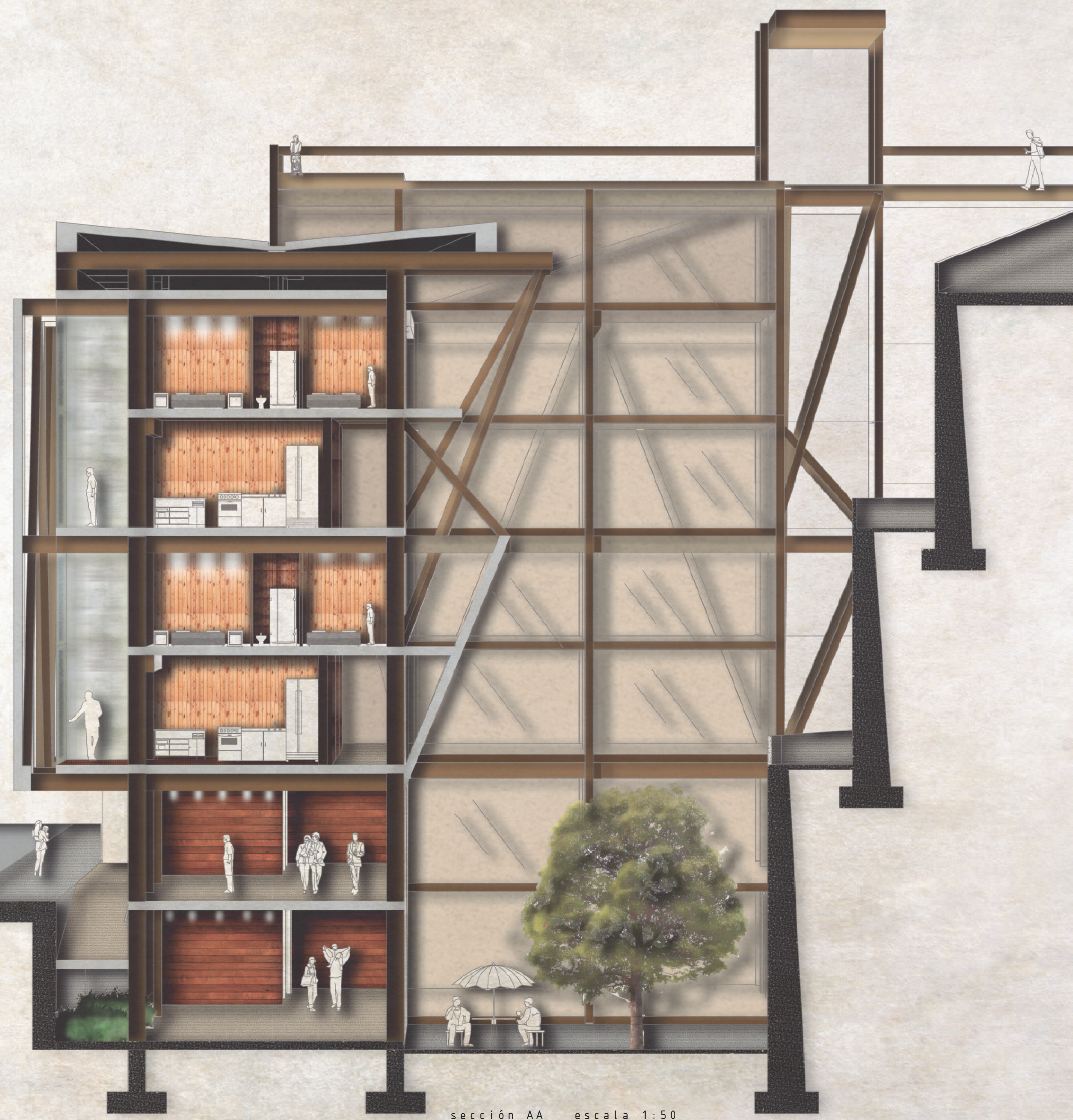
sección AA escala 1:50

El programa complementario busca su lugar en el barrio, entrando en consideración con el comercio gastronómico y turístico como espacios de uso público, separándolos del espacio habitable de los residentes en pisos superiores. El muro, utilizado como jardín vertical residencial y como conexión principal entre las calles Serrano y Castillo a través del ascensor vertical público arraiga el proyecto a su lugar de emplazamiento, tanto por su objetivo conector como por referencia de trazado del proceso formal.