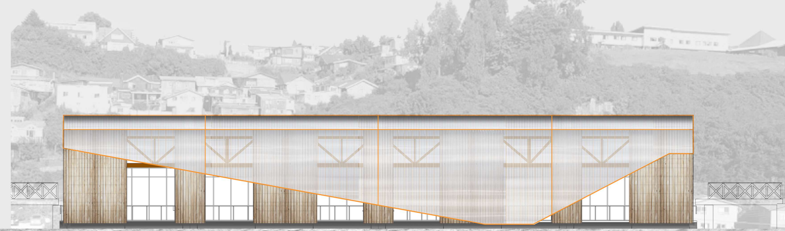
ELEVACION ORIENTE ESC 1:200