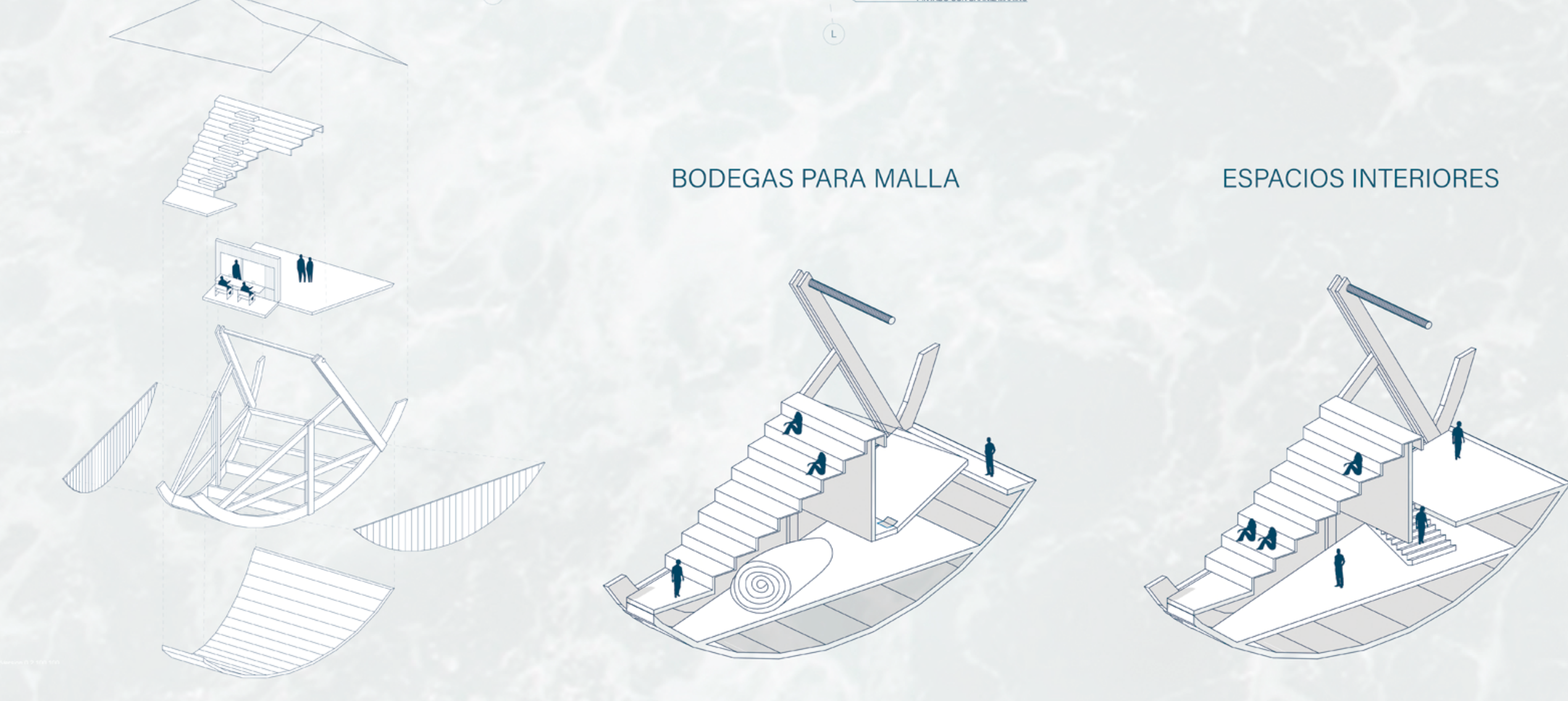
SEMANA DE LA MADERA