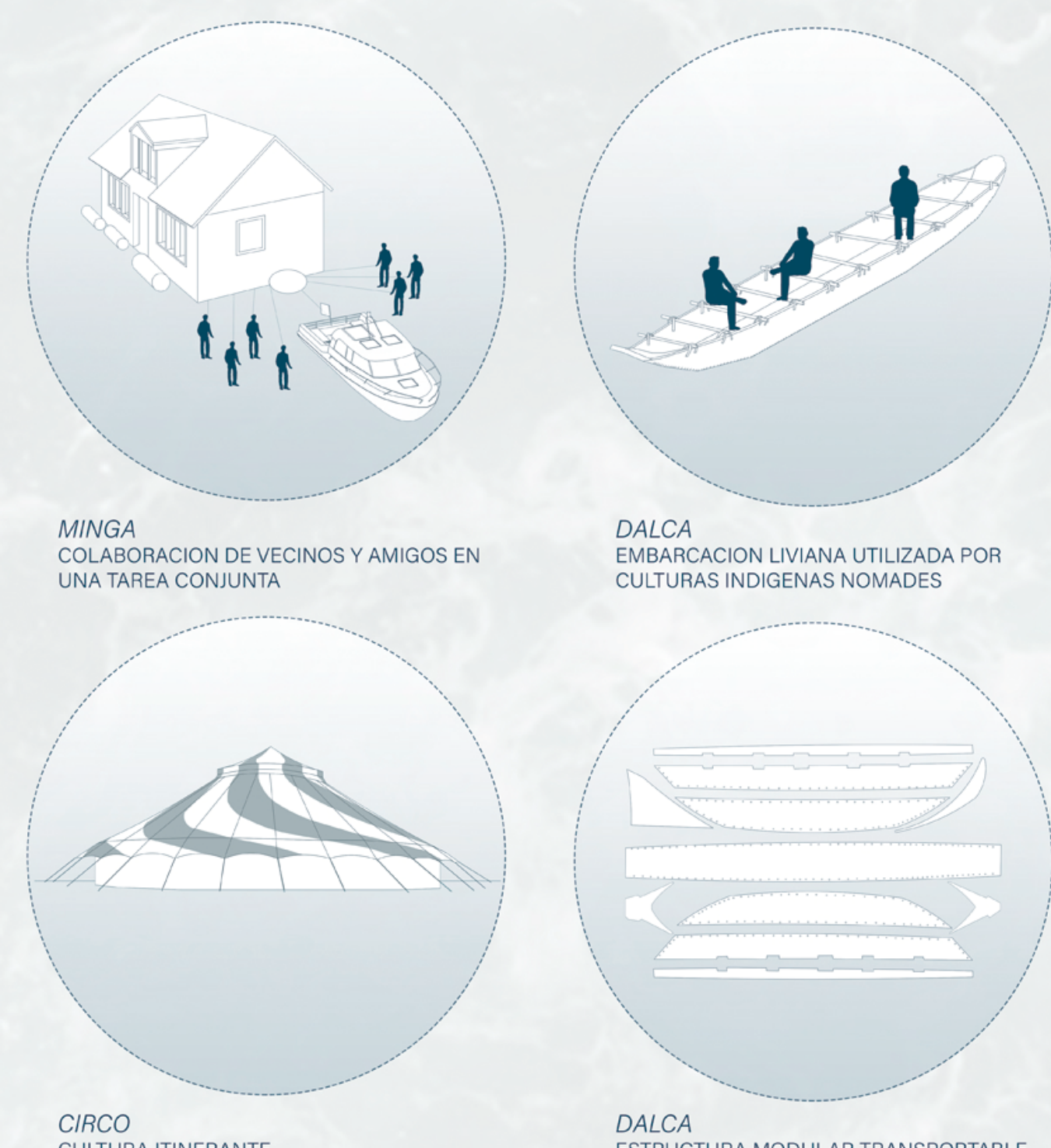
MINGA COLABORACION DE VECINOS Y AMIGOS EN UNA TAREA CONJUNTA DALCA EMBARCACION LIVIANA UTILIZADA POR CULTURAS INDIGENAS NOMADES CIRCO CULTURA ITINERANTE ESPACIALIDAD RADIAL ESTRUCTURADA POR MALLA / CARPA DALCA ESTRUCTURA MODULAR TRANSPORTABLE