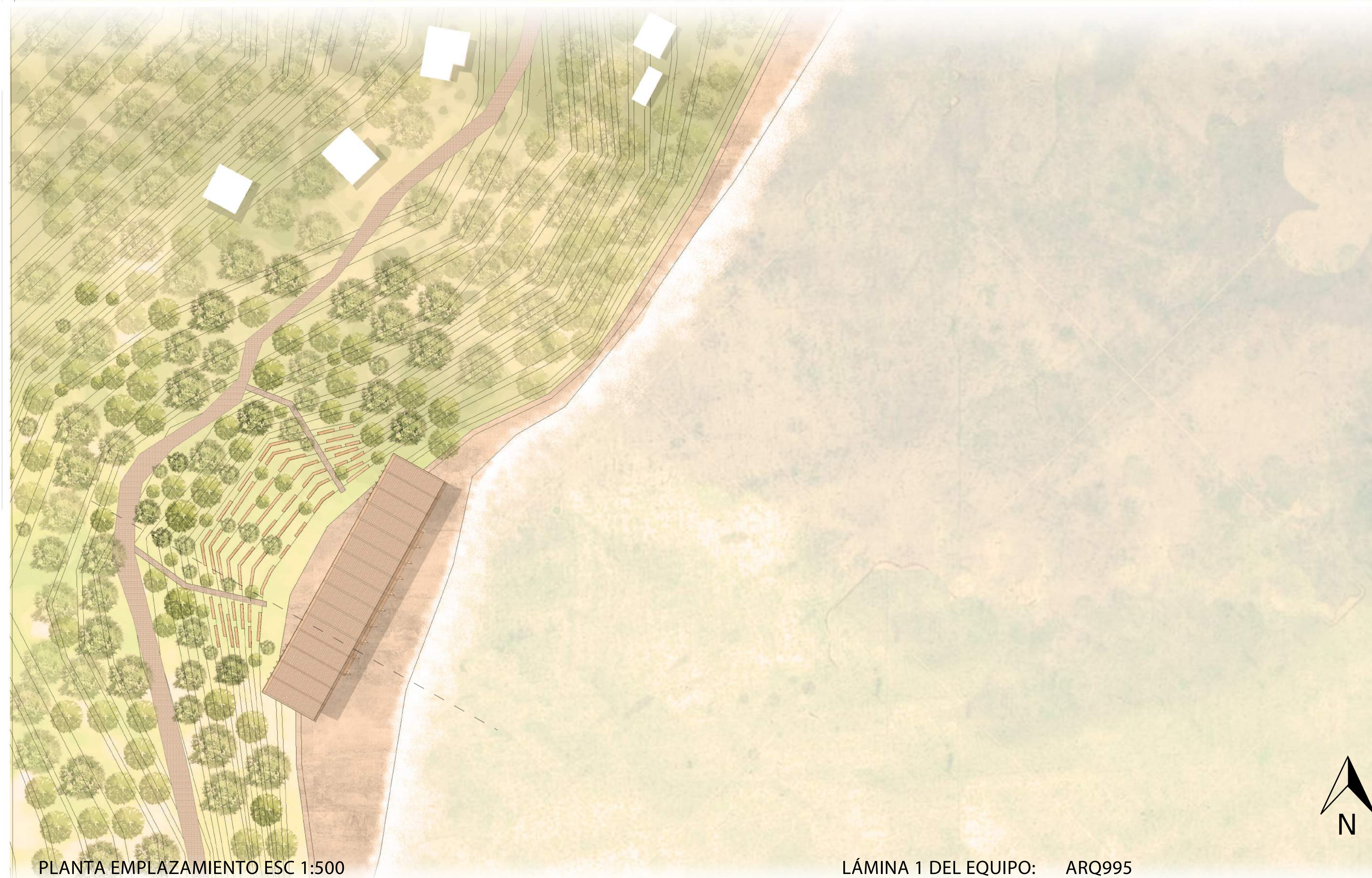
PLANTA EMPLAZAMIENTO ESC 1:500