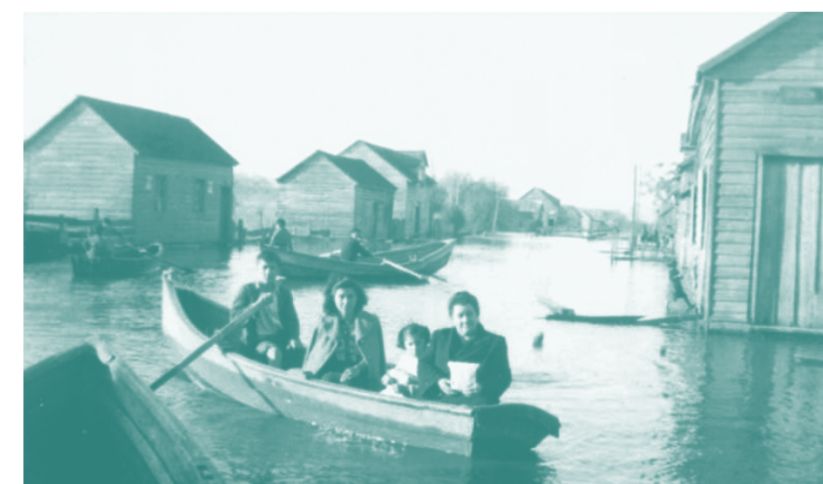
Toltén antiguo inundado.