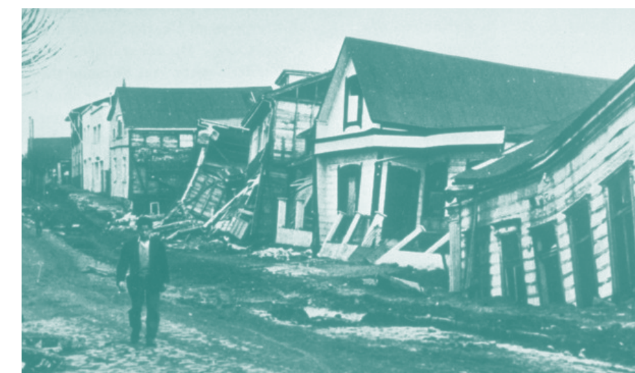
Desastre maremoto 1960