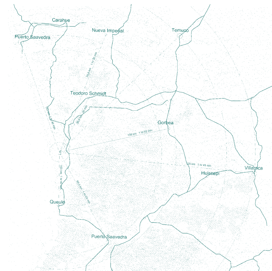
Alcance de Región