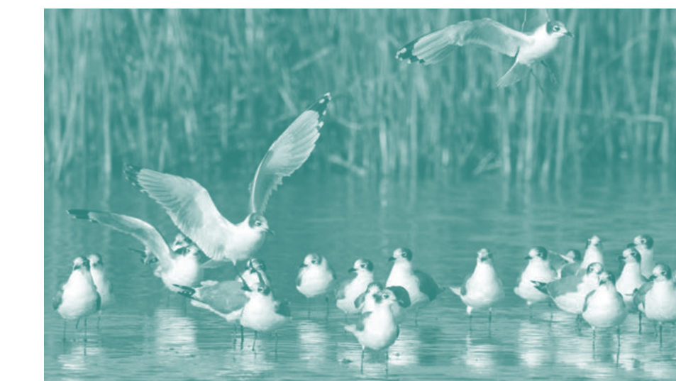
Flora y Fauna de humedal