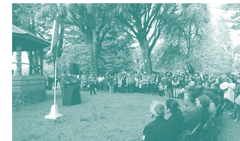
Conmemoración de Víctimas del suceso