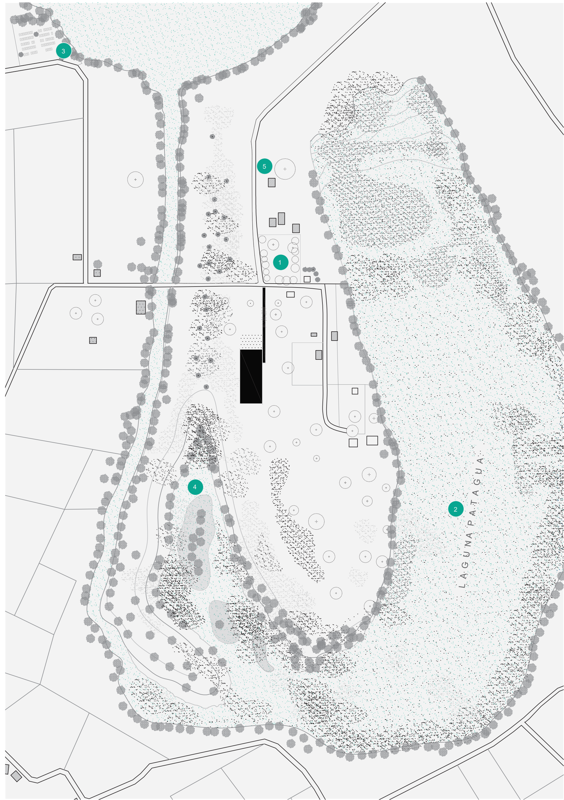
PLANO TOLTÉN ANTIGUO ESC 1.3000

Toltén después de la catástrofe en 1960, sigue con vida. Su geografía son producto del río Toltén, que alimenta la laguna Patagua, la cuál por la constante crecida y bajada del agua forma un humedal lleno de especies, atrayendo a varios turistas al lugar para poder apreciar este espectáculo natural y histórico. En la zona, luego del traslado del Pueblo quedaron vestigios dentro territorio que dan cuenta de la historia que existió en aquel lugar, entre ellos podemos encontrar el cementerio municipal que también funciona como punto de encuentro para la conmemoración de los fallecidos en la catástrofe, al igual que la Plaza Angamos que cuenta con un pequeño memorial rodeado de arboles de unos 25 a 30 metros de altura.