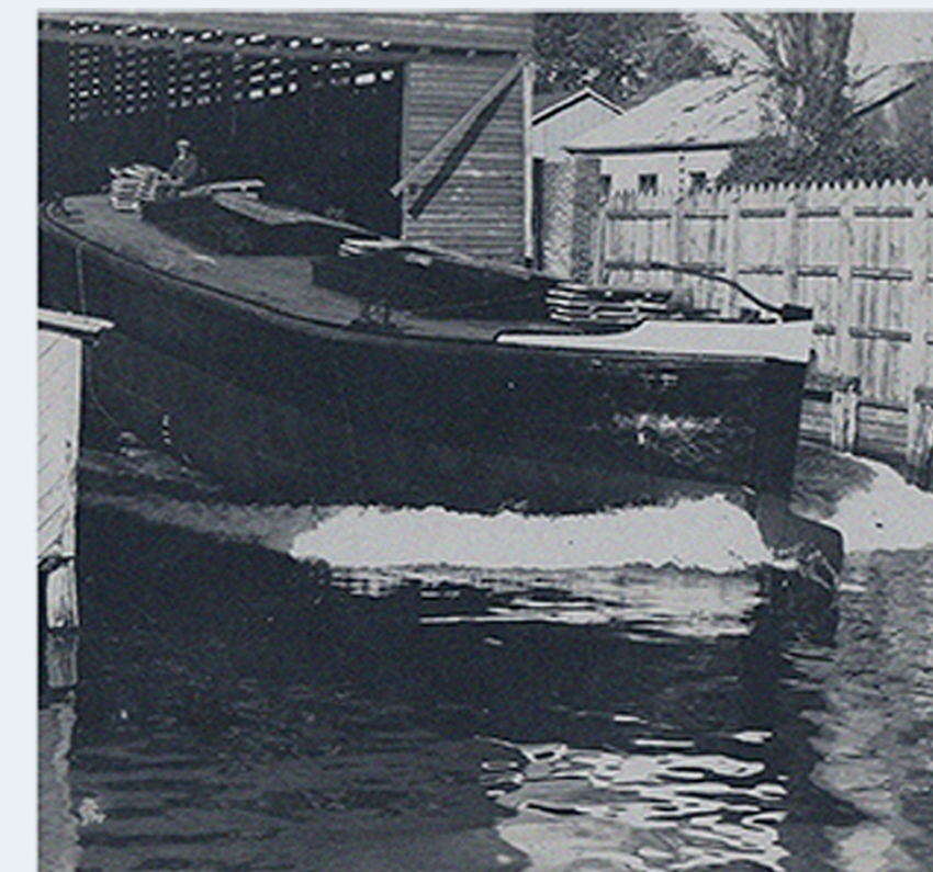
Calaguala, F. (1930) Amigueros astilleros en la riera del Río Valdivia. [fotografía]. Recuperada de http://www.centrorenos.com

El Proyecto se sitúa en la Isla Teja en la ciudad de Valdivia. La elección del sitio fue a partir de un análisis de la ciudad en el cual se levantaron: áreas verdes, zonas industriales, la trama fluvial, las vías principales y también otros establecimientos educacionales. Desde ahí se escogió un sitio de 10.400 m 2 , situado al sur-este de la isla. El terreno colinda con la oficina regional de la Conaf, al frente se encuentran el Muelle Fluvial de la ciudad y el Museo Naval submarino O'Brien. En el sector también se encuentra el campus principal de la Universidad Austral, además de distintos recintos educacionales, lo que refuerza el sector como "zona educativa". También, el lote fue elegido por su condición geográfica; este se sitúa entre el borde del río Callecale y un humedal protegido, lo que además le otorga una condición de meseta al sitio.