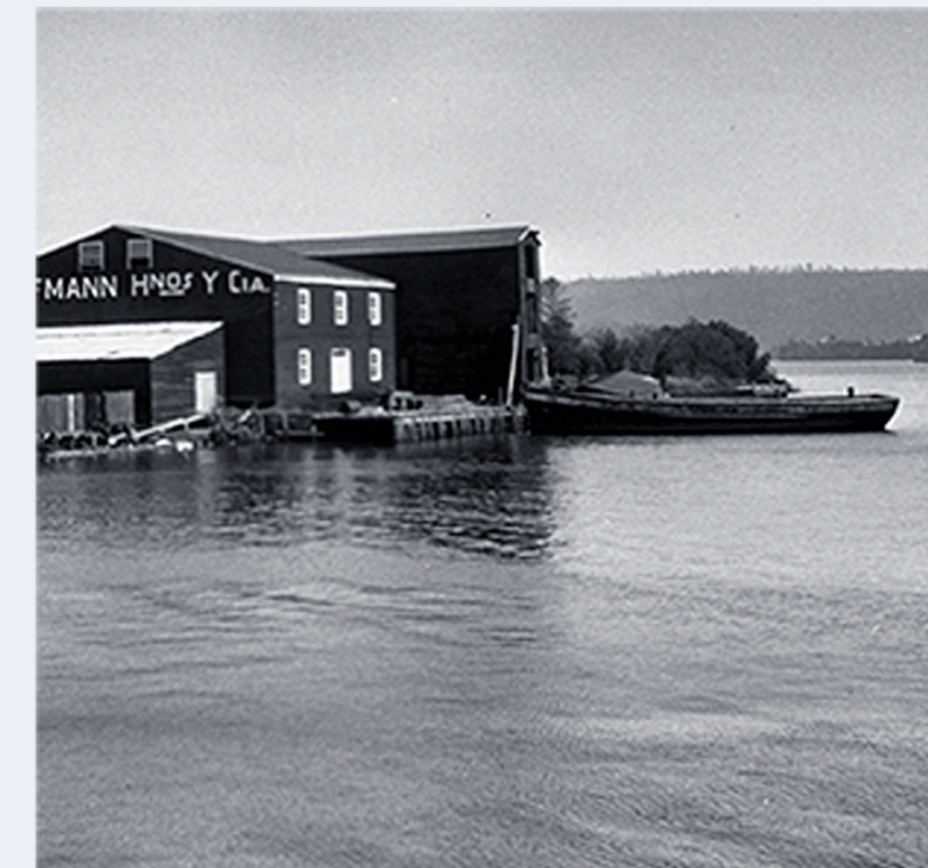
Calaguala, F. (1930) Amigueros astilleros en la riera del Río Valdivia. [fotografía]. Recuperada de http://www.centrorenos.com

Valdivia tiene una larga trayectoria histórica relacionada con la construcción naval. Así, el programa corresponde a un liceo técnico especializado en construcción de botes, cuya propuesta se plantea a partir de los galpones tradicionales de astilleros de Valdivia. De este modo, el programa se constituye en el interior de un gran fusilaje emplazado a lo largo del sitio, dialogando con el humedal y el borde del río. Además, a partir las referencias históricas, se decide posar el volumen sobre agua, para acceder de forma directa y proteger la zona de trabajo. Este galpón permite generar un espacio interior intermedio, continuo a lo largo de todo el establecimiento. Esto resulta especialmente útil considerando el clima lluvioso de la ciudad, dado que se resguarda la mayor parte del programa bajo techo y en un único espacio.