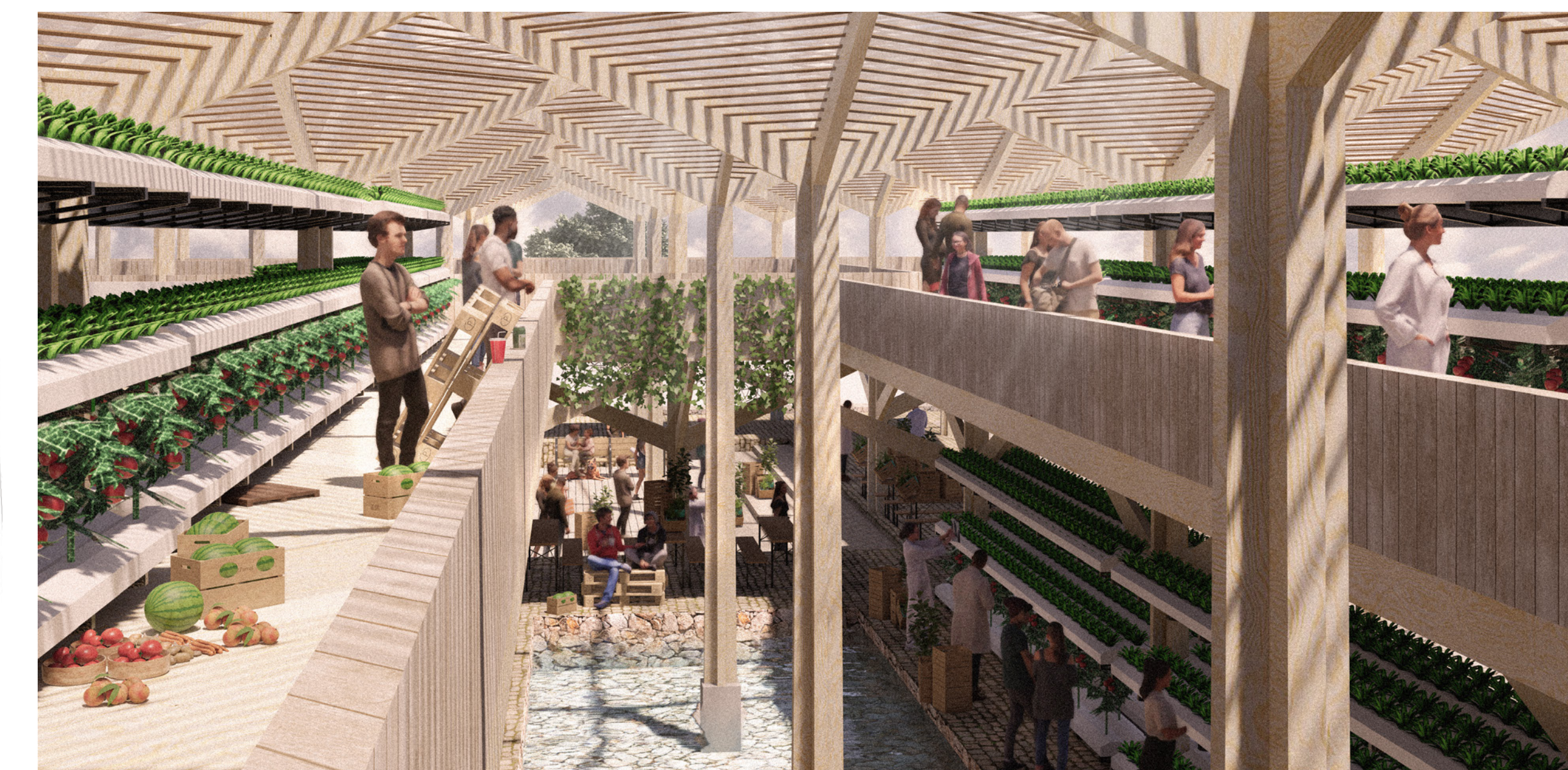
Torres de Cultivo Hidropónico