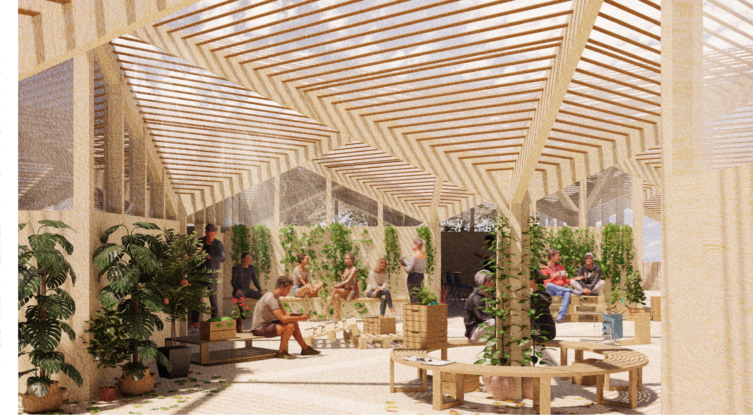
Patio Entre Salas