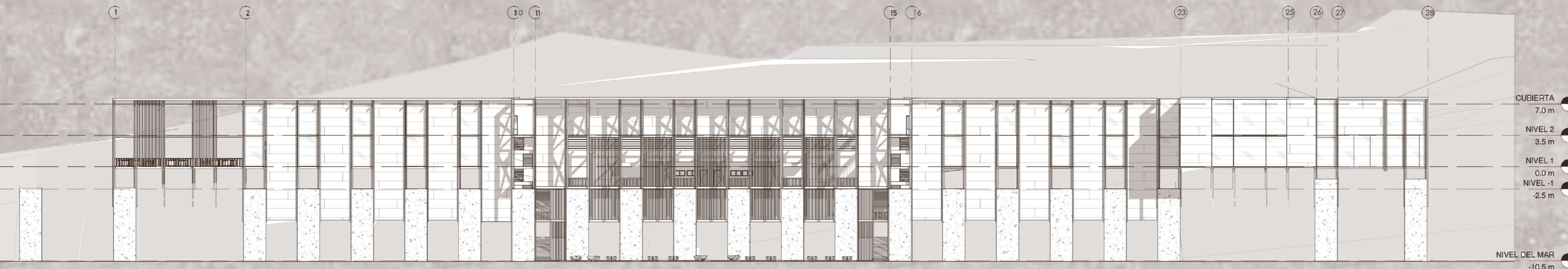
Elevación Este / Esc 1:250