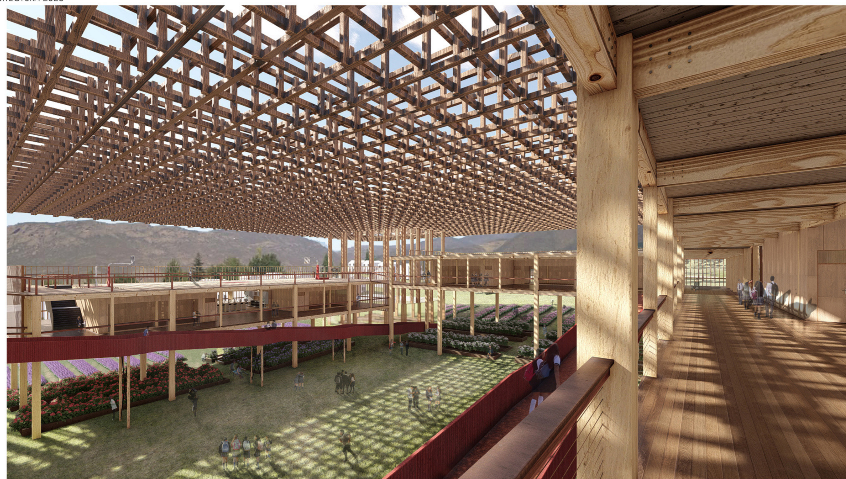
Escena de un día habitual en el patio de la escuela, actividades lúdicas, trabajos de floricultura (imagen superior). Escena invernadero interna, ubicada en los pilares (imagen posterior)