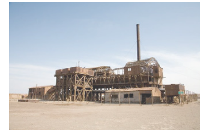
PATRIMONIO ARQUITECTÓNICO OFICINA SALITRERA SANTA LAURA

LA ESTRUCTURA DEL CRYSTAL PALACE SE CONVIRTIÓ EN REVOLUCIONARIA POR SU DIMENSIÓN Y CONCEPTOS DE INVERNADEROS Y ROBUSTEZ, TAMBIÉN POR ESTAR COMPUESTO POR MÓDULOS ESTANDARIZADOS Y UN SISTEMA DE BÓVEDA ALCANZANDO GRANDES LUCES, CONVIRTIENDO UN EDIFICIO MÁS LUMINOSO CON TECHOS VIDRIADOS PERMITIENDO QUE LA LUZ FLUYESE LIBREMENTE AL INTERIOR.