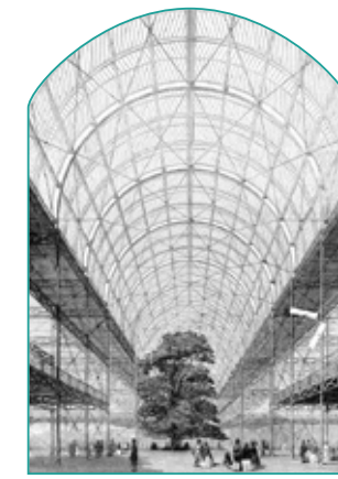
EL EDIFICIO COMO OASIS THE CRYSTAL PALACE 1850 - JOSEPH PAXTON, OWEN JONES

LA ESTRUCTURA DEL CRYSTAL PALACE SE CONVIRTIÓ EN REVOLUCIONARIA POR SU DIMENSIÓN Y CONCEPTOS DE INVERNADEROS Y ROBUSTEZ, TAMBIÉN POR ESTAR COMPUESTO POR MÓDULOS ESTANDARIZADOS Y UN SISTEMA DE BÓVEDA ALCANZANDO GRANDES LUCES, CONVIRTIENDO UN EDIFICIO MÁS LUMINOSO CON TECHOS VIDRIADOS PERMITIENDO QUE LA LUZ FLUYESE LIBREMENTE AL INTERIOR.