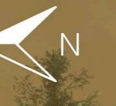
CORTE TRANSVERSAL E. 1:150