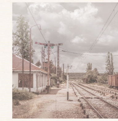
La Estación Emplazamiento

Vestigio arquitectónico más importante del sector, construido junto al Ferrocarril Talcahuano-Chillán y Angol a fines del siglo XIX. Forjó la urbanización del área entendiendo a Coihue como un punto confluencia en la conectividad.