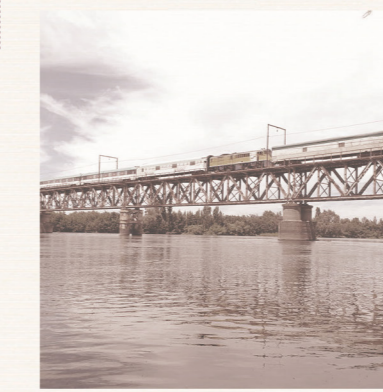
El Puente Sistema constructivo

Fue un hito importante para el ordenamiento territorial de las primeras comunidades mapuches. El Río Bío Bío cruza gran parte de la zona centro-sur de Chile. Entendiendo el cauce como límite y fuente de múltiples ecosistemas.