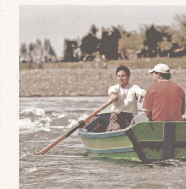
El Río Arraigo al borde

Siendo un escenario propio de la percepción del paisaje sureño, la agricultura en Chile tiene un alto valor paisajístico. El cultivo configura un paisaje estacionario y horizontal, corrompiendo el espacio orgánico para ordenarlo.