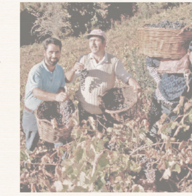
El Cultivo Ciclo educativo y la vid

Vestigio arquitectónico más importante del sector, construido junto al Ferrocarril Talcahuano-Chillán y Angol a fines del siglo XIX. Forjó la urbanización del área entendiendo a Coihue como un punto confluencia en la conectividad.