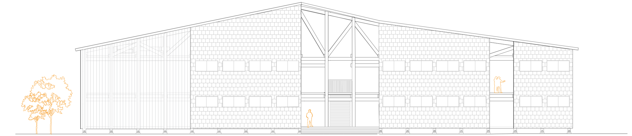
Elevación sur Esc.1:200