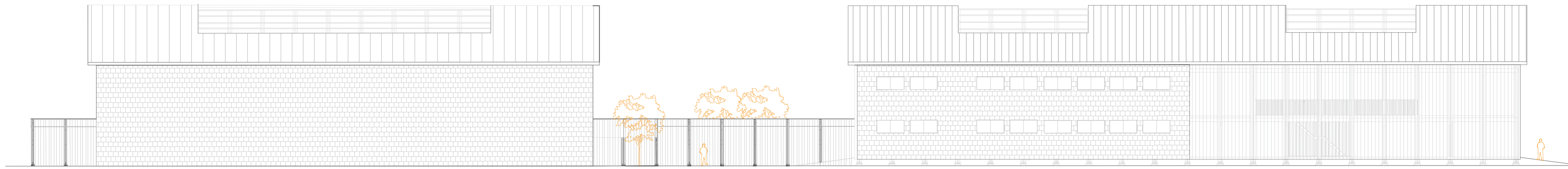
Elevación oeste Esc. 1:200