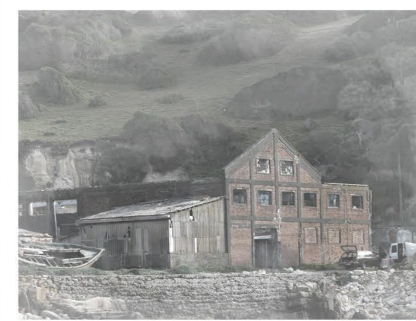
RUINAS BALLENERA CHOME

La cacería de ballenas fue una de las principales actividades comerciales de la región hasta su cierre en el año 1981, debido a la prohibición de la caza de esta increíble especie. Hoy solo pertenece al imaginario del lugar.