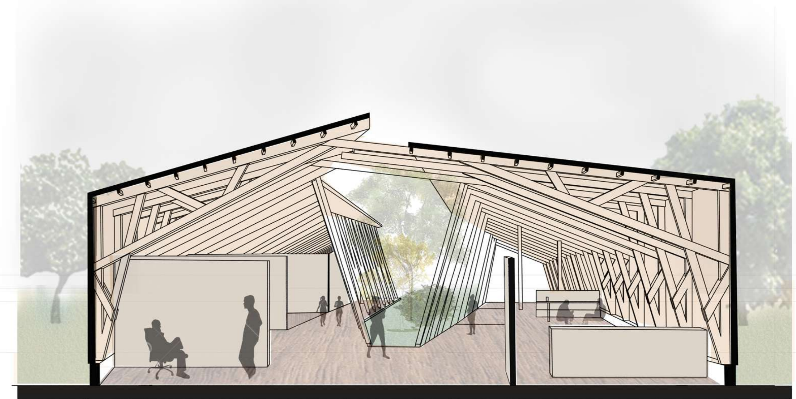
CORTE FUGADO A-A' TRANSVERSAL ESCALA 1/50