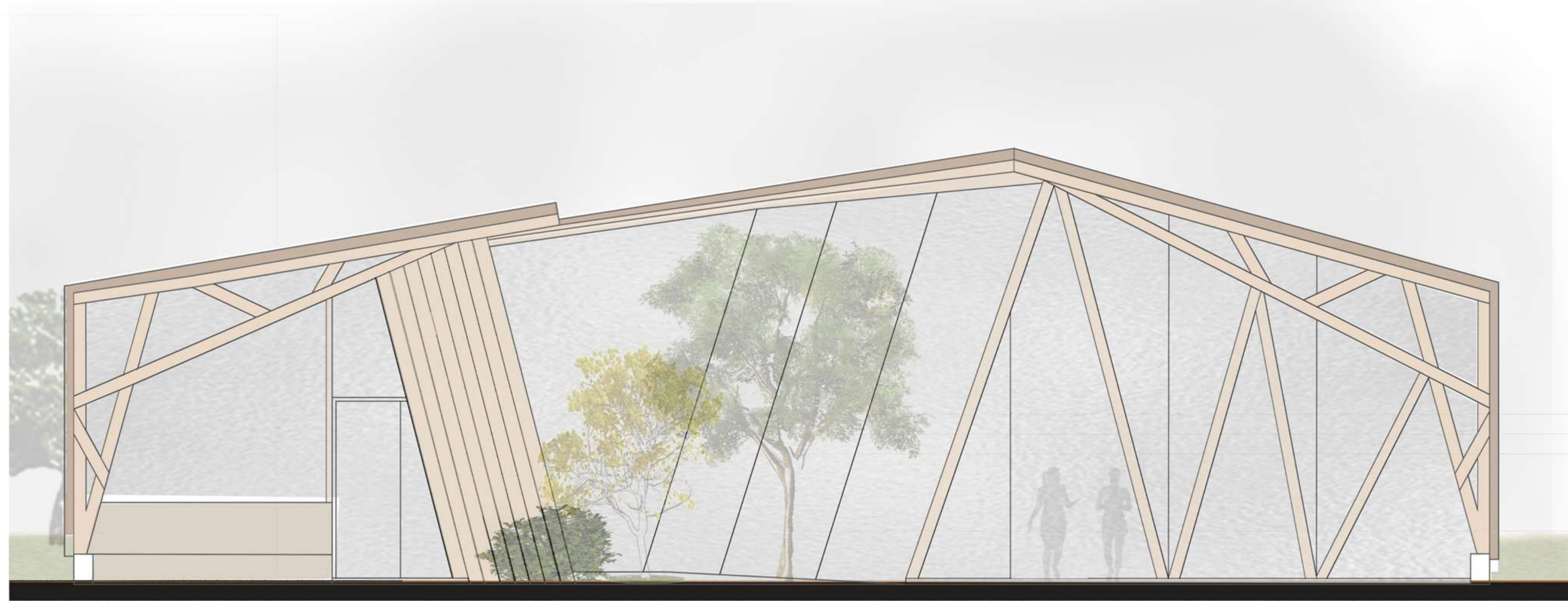
ELEVACIÓN FRONTAL ESCALA 1/50