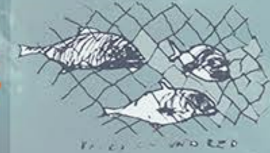
Quedando atrapados en ella el cardumen.