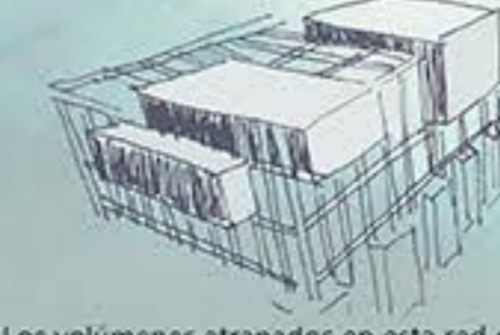
Los volúmenes atrapados en esta red generan espacios flexibles que dan cabida a un nuevo concepto educativo.