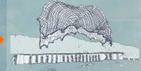
La red es lanzada sobre las pilas que sostuvieron el antiguo Puerto de la Dársena.