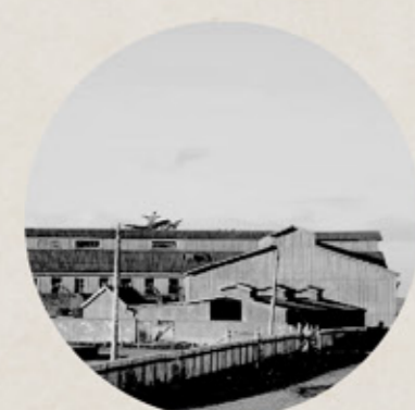
ESTANCIA SAN GREGORIO Antoine Beaulier