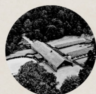
EQUESTRIAN PROJECT CC Arquitectos