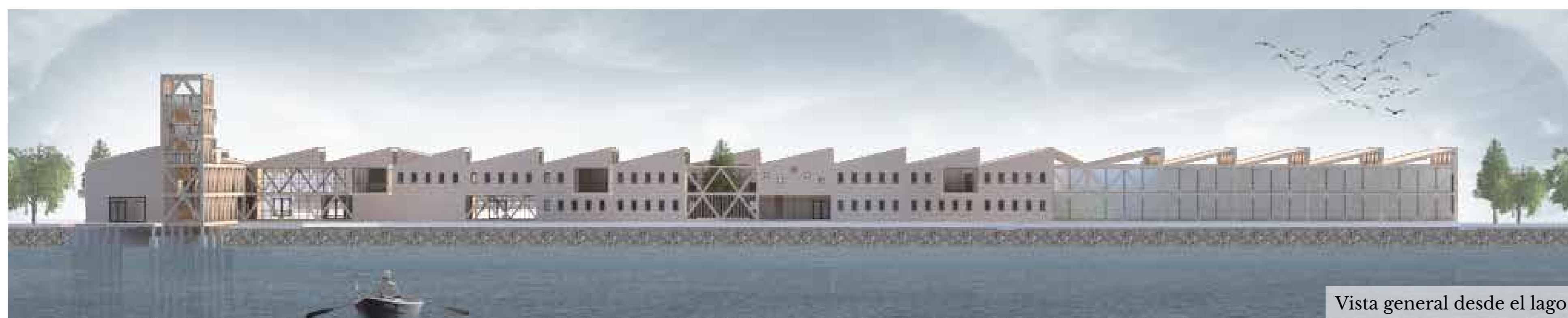
Vista general desde el lago