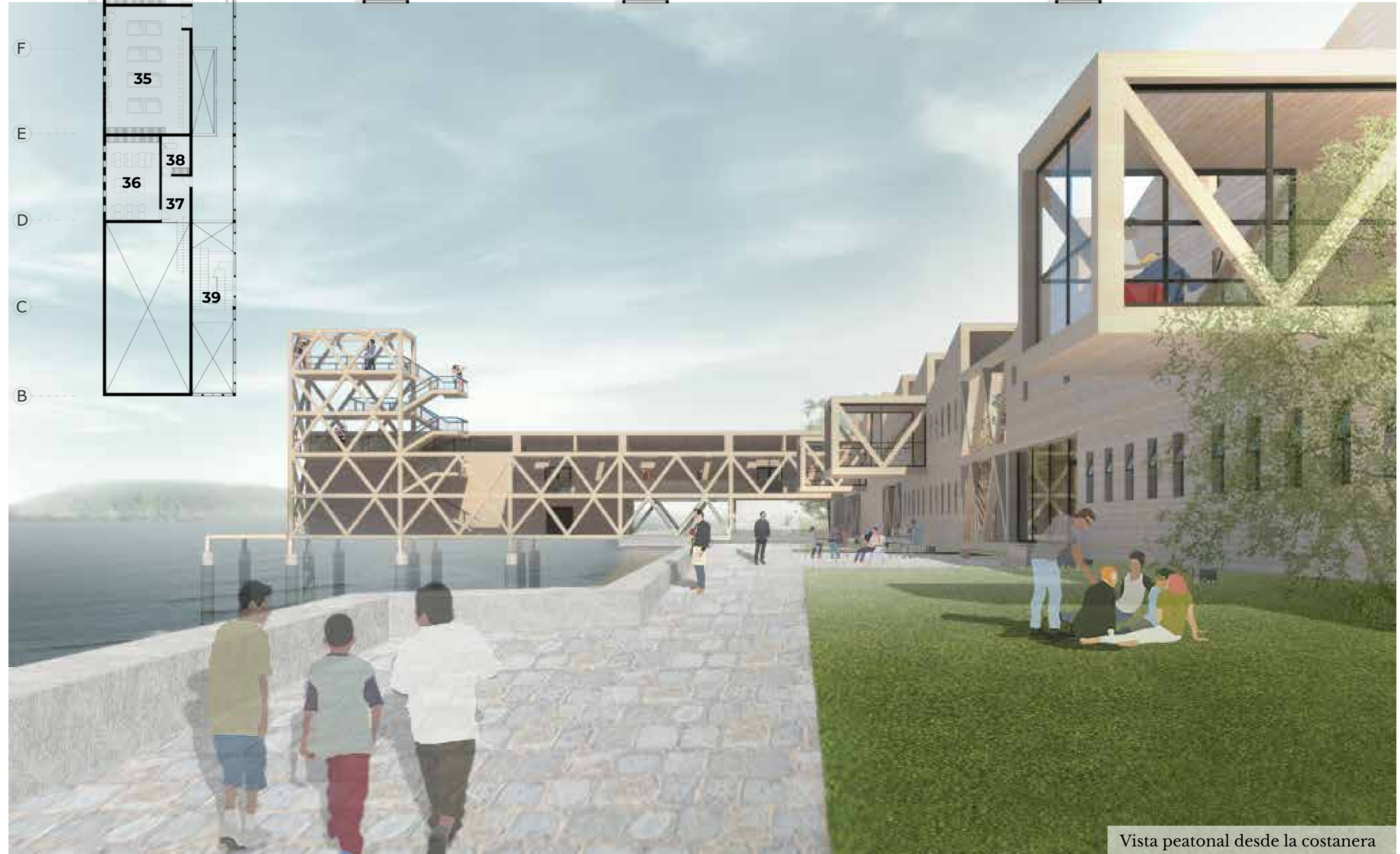
Vista peatonal desde la costanera