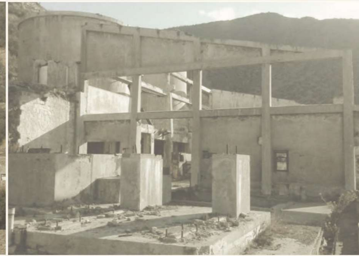
Marco de Hormigón Ex mina La Africana.