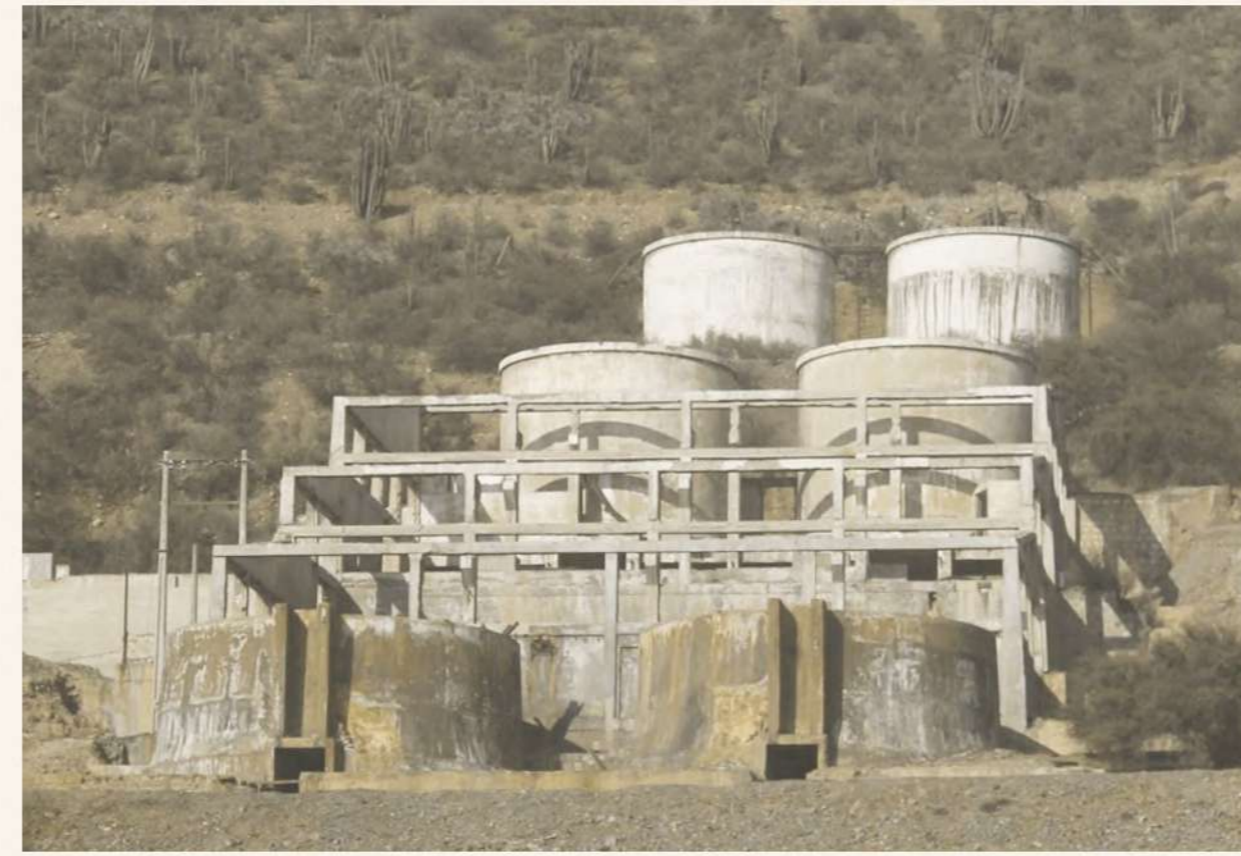
Planta de Concentrado Ex mina La Africana.