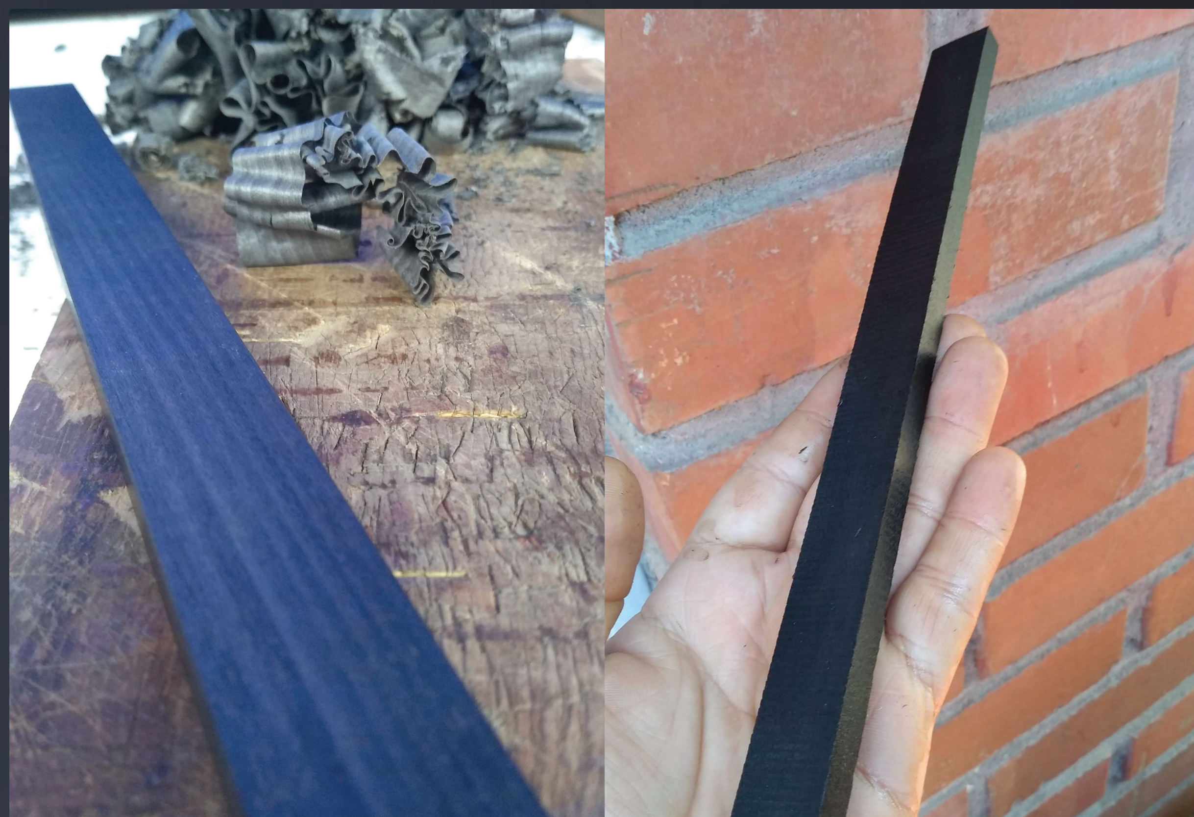
Prueba de Ebonizado por inmersión a una pieza de Rauli