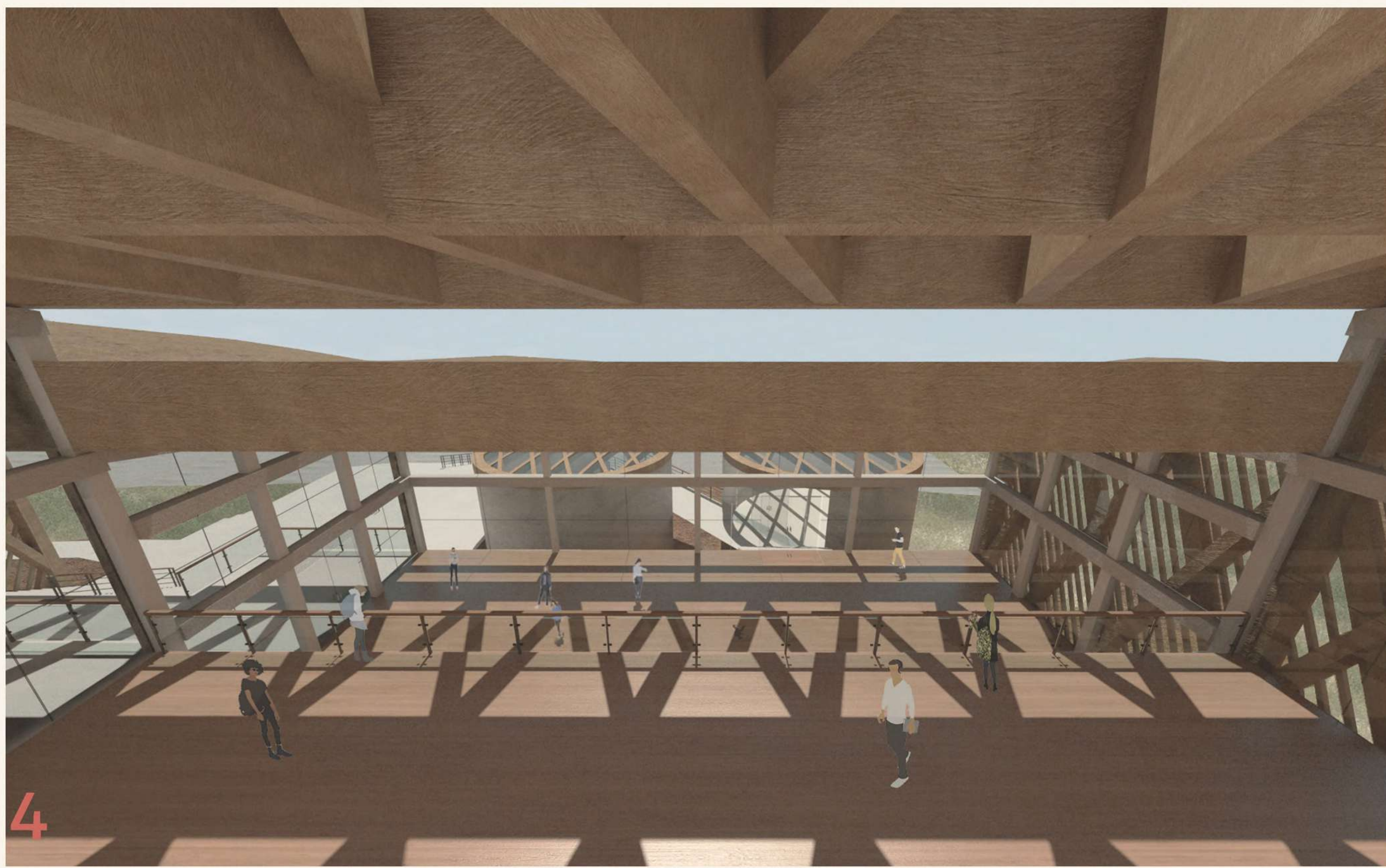
4 Vista interior del instituto y áreas libres, donde se aprecian la cercanía y la proyección de sombra del entramado