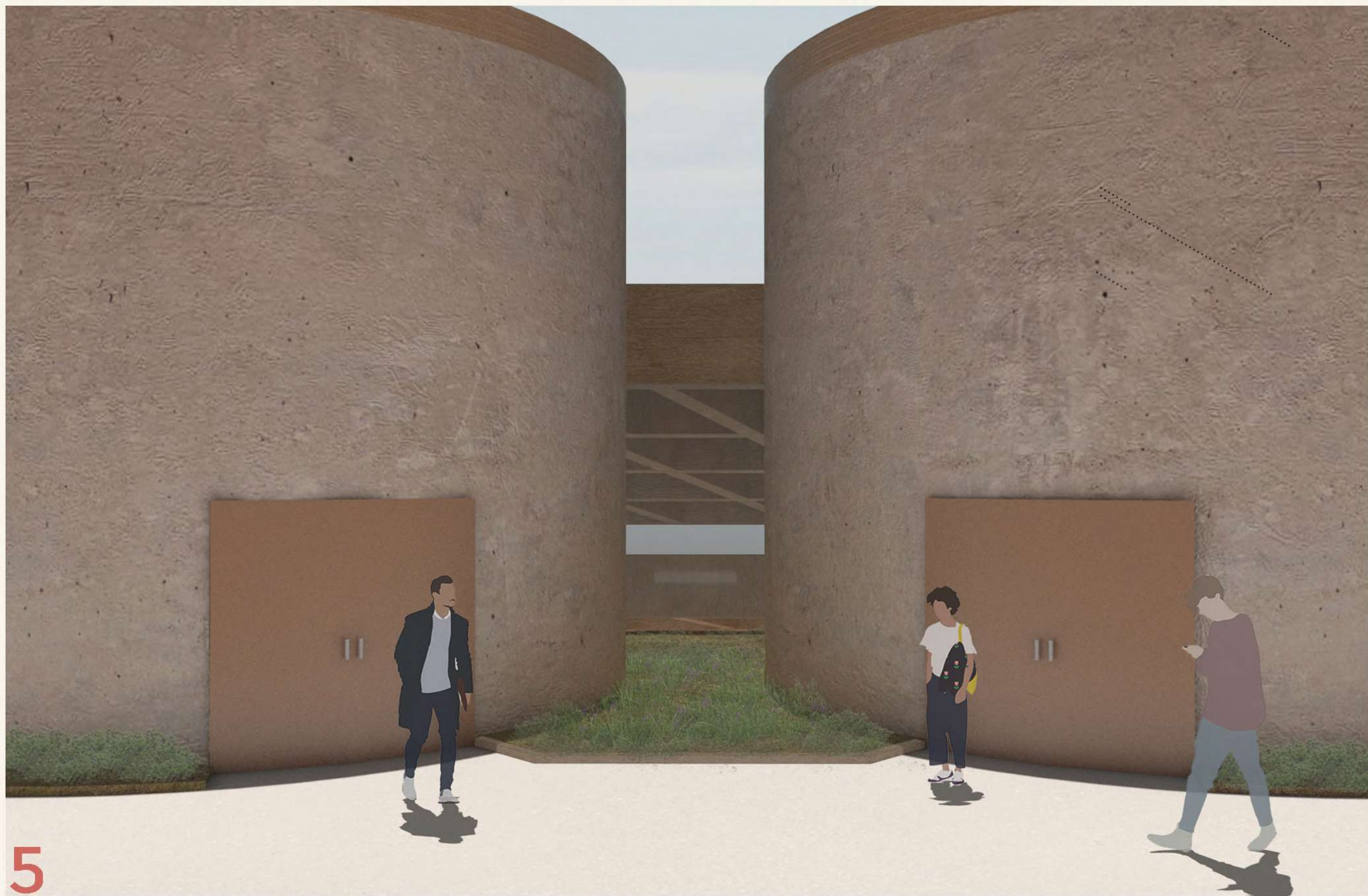
5 Nivel Superior y silos con nueva funcionalidad de auditorio